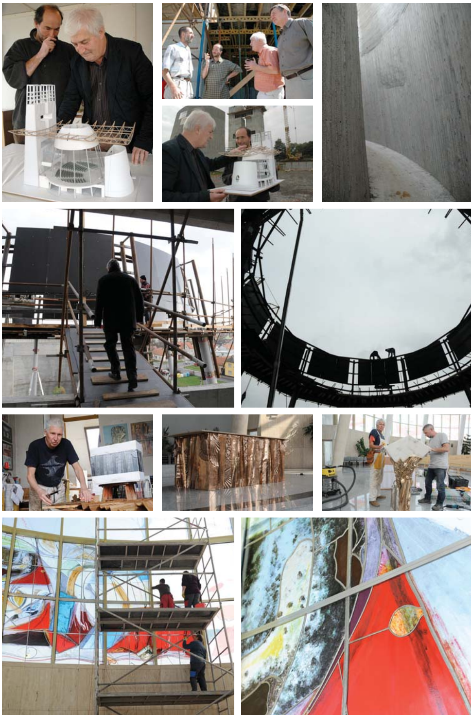
Stavba kostela sv. Ducha ve Starém Městě ve fotografiích Milana Zámečnicka.