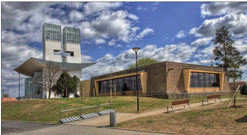
Kostel Svatého Ducha ve Starém Městě, 2015.

snadnila provádění stavby, neboť se jednalo o zbořeníště průmyslové budovy, jejíž podzemní části nebyly při předešlé likvidaci demolovány. Stavba byla realizována bez generálního dodavatele, neboť investor nemohl zaručit smluvní cash-flow. Byly proto tvořeny realizační etapy, na které byly vypisovány samostatné tendry.