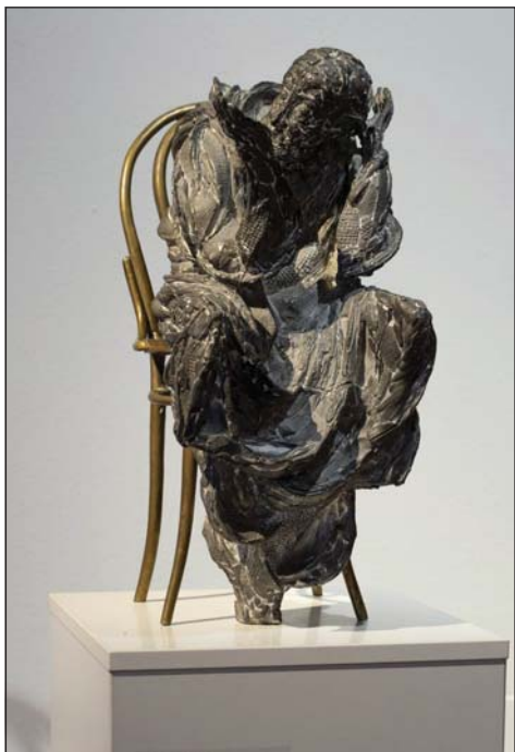
Leopold Mandič, bronz, olovo, 1994. Sbíрка Slovákého muzea v Uherském Hradišti.

Ceny (výběr): cena ateliéru za pomník rodu Dientzenhoferů, Labyrint světa a ráj srdce, 1993 Cena Masarykovy akademie umění, 1998 Pamětní