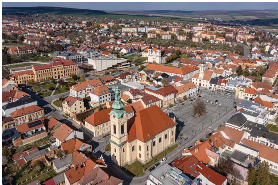
Letecký pohled na současný Uherský Brod s centrální oblastí dvou náměstí rozdělených vloženými bloky domů. Město Uherský Brod.

existenci města svědčí listina Přemysla Otakara II. z 27. ledna 1267, vydaná u Brodu ( ante Brodam ). 63 Současně dosvědčuje, že město ještě zdaleka nebylo dokončeno. Panovník tak nemohl využít jeho pohostinství a pobýval v táboře „v poli“ v jeho blízkosti.