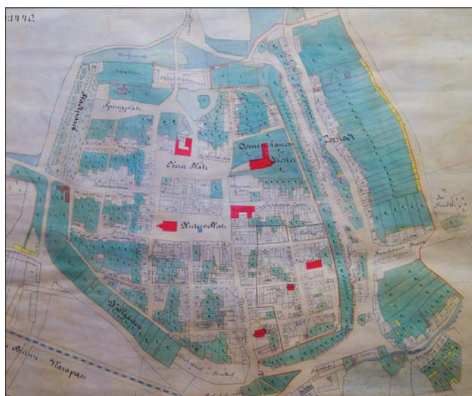
Nízkou míru zastavěnosti intravilánu města Uherský Brod ještě v 19. století dokládá plán města z roku 1889. Muzeum Jana Amose Komenského Uherský Brod.

U lokace města Uherský Brod se můžeme vztahovat hned k několika možným datům. Jednak k ukončení právní konstituce města Uherské Hradiště roku 1258, 58 kdy již panovník musel tušit (a okolnosti vzniku listiny tomu nasvědčují) míru kompromisů, jež je nucen v důsledku učinit vůči mocnému velehradskému klášteru. Dále je tu zpráva o založení dominikánského kláštera, umístěného v areálu města, v roce 1262 (ačkoliv první spolehlivá relace potvrzující existenci kláštera je až z roku 1338). 59 Otázkou rovněž je, zda snaha velehradských cisterciáků o potvrzení jejich privilegií a majetků, která došla naplnění v roce 1261, 60 nebyla mimo jiné vedena i událostmi vznikajícího města Uherský Brod, respektive ryze městské fundace konkurenčního řádu dominikánů? 61 Miroslav Plaček a Peter Futák uvažují o podílu Smila ze Stríleka na vysazení města Uherského Brodu, které vztahují k roku 1260, přičemž připomínají, že o 12 let později jako svědek asistoval i u privilegia, kterým město obdrželo hlubčické právo. 62 O vlastní