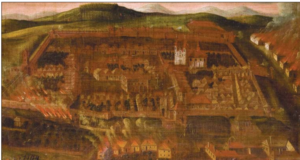
Nízkou zastavěnost areálu města Uherský Brod ukazuje barokní znázornění obležení města kurucí Františka II. Rákocziho na počátku 18. století. Muzeum Jana Amose Komenského Uherský Brod.

U lokace města Uherský Brod se můžeme vztahovat hned k několika možným datům. Jednak k ukončení právní konstituce města Uherské Hradiště roku 1258, 58 kdy již panovník musel tušit (a okolnosti vzniku listiny tomu nasvědčují) míru kompromisů, jež je nucen v důsledku učinit vůči mocnému velehradskému klášteru. Dále je tu zpráva o založení dominikánského kláštera, umístěného v areálu města, v roce 1262 (ačkoliv první spolehlivá relace potvrzující existenci kláštera je až z roku 1338). 59 Otázkou rovněž je, zda snaha velehradských cisterciáků o potvrzení jejich privilegií a majetků, která došla naplnění v roce 1261, 60 nebyla mimo jiné vedena i událostmi vznikajícího města Uherský Brod, respektive ryze městské fundace konkurenčního řádu dominikánů? 61 Miroslav Plaček a Peter Futák uvažují o podílu Smila ze Stríleka na vysazení města Uherského Brodu, které vztahují k roku 1260, přičemž připomínají, že o 12 let později jako svědek asistoval i u privilegia, kterým město obdrželo hlubčické právo. 62 O vlastní