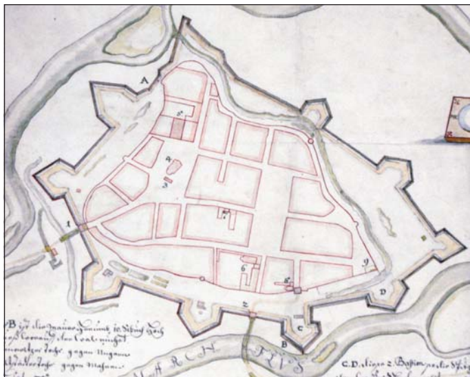
Plán města Uherské Hradiště z roku 1716 (výřez). Norbert Wencel Linck. Slovácké muzeum v Uherském Hradišti.

zmínka), je považováno tzv. slavičinské privilegium olomouckého biskupa Brunona ze Schauenburku určené jeho leníku Helembertovi de Turri z 2. června 1256, hovořící o slavičinské provincii jako o pusté a řídko osídlené (se vsí Prakšice nedaleko Brodu, vyjímaje pouze další dvě vesnice – Bílovice a Biskupice). 57 Tato zmínka pouze zdůrazňuje větší význam Uherského Brodu ve srovnání s okolním osídlením, nevypráví však nic o procesu vzniku města. Je otázkou, do jaké míry již v tomto roce město stálo. Mohlo ale již být stavěno, jak by naznačovala formulace hovořící o vsi Prakšice, ležící před Brodem.