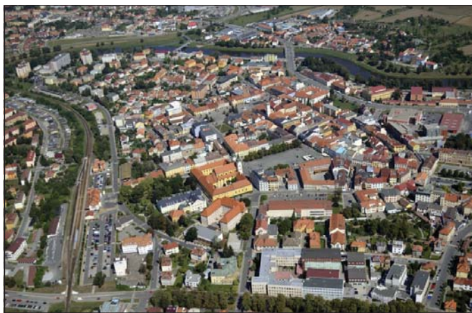
Letecký pohled na současné Uherské Hradiště dokládá, že základní koncept středověkého města zůstal zachován dodnes. Město Uherské Hradiště.