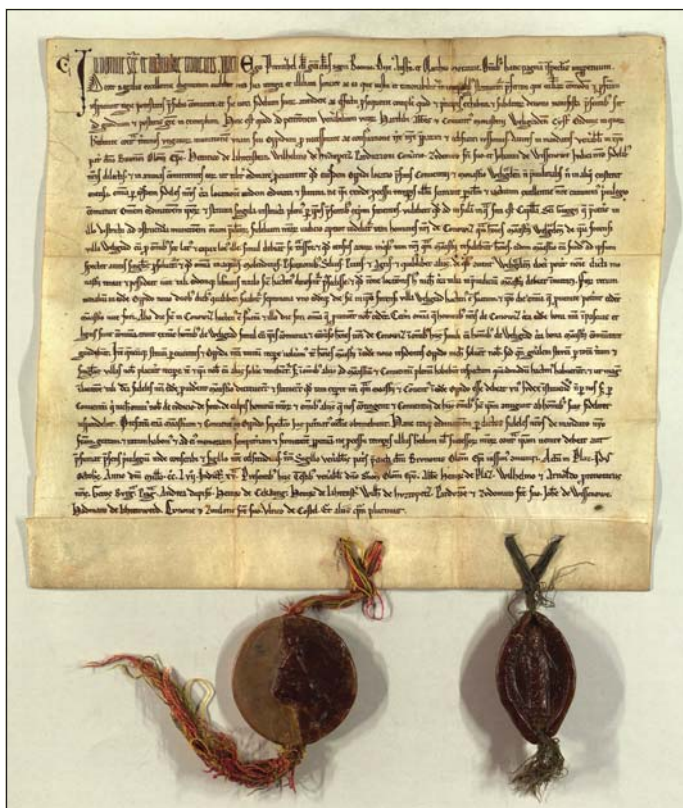
Listina vydaná českým králem Přemyslem Otakarem II. obyvatelům Uherského Hradiště dne 15. října 1257. Moravský zemský archiv v Brně, fond E 7 Cisterciáci Velehrad 1222–1777, 1257 X 15.