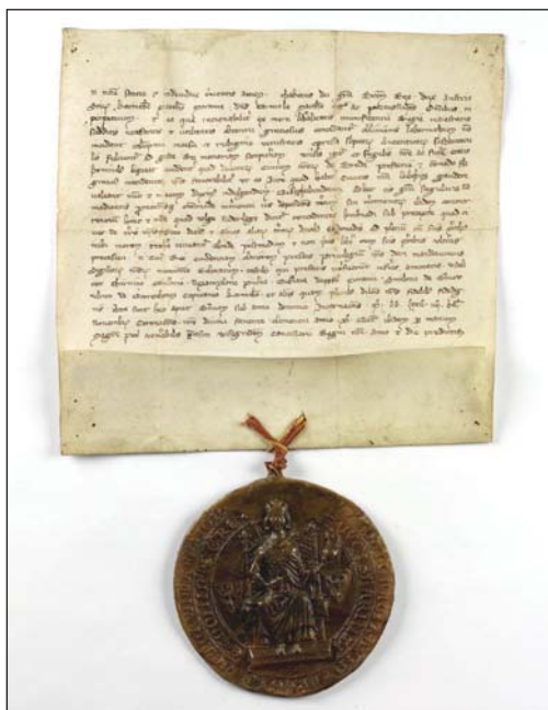
Obr. 9. Privilegium českého krále Přemysla Otakara II. z roku 1272 potvrzující Uherskému Brodu městská práva. Státní okresní archiv Uherské Hradiště, fond Archiv města Uherský Brod, listiny, sign. L 1151.

To již (patrně zejména díky zmíněnému značnému poškození v uplynulých válkách) započal pomalý úpadek města a jeho cesta do šlechtických rukou. K první zástavě města