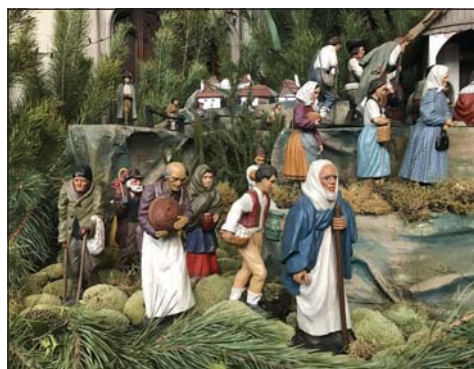
Darovníci v lednickém betlémě, v pravém horním rohu žena v dobovém oděvu, 2021.