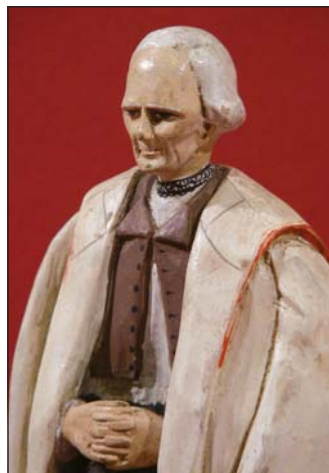
Detail postavy J. Rabuše v lužickém betlémě, 2008.

Kromě dospělých postav přicházejí k lužickým jesličkám i děti v krojích. Dvě děti mají na sobě sváteční kroj, zmenšenou podobu kroje šohaje a dívky. Dívka v růžové sukni nese košík s dárkem pro Ježíška, na rozdíl od dospělé dívky nemá vlasy zapletené na zahrádku , pod krkem nemá krejzlík a přední mašle není malovaná. Chlapec v modře šňurovaných červenicích je bez kapesníčku v rozparku, kolem krku nemá uvázaný šáteček a v ruce drží svůj klobouček, správně bez kosárku . Nejmenšími dětmi jsou chlapec a děvčátko. Chlapec má na sobě