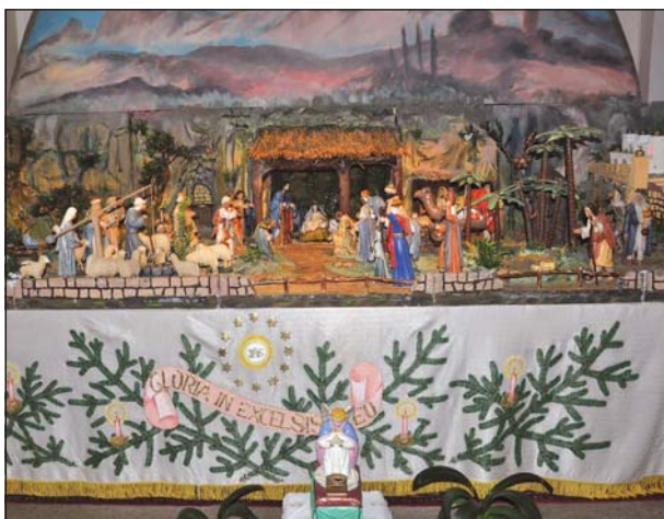
Současná podoba betlémě ve Tvrdonicích, 2021.