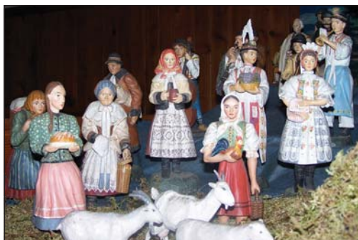
Krojovaní darovníci v lužickém betlémě, 2008.