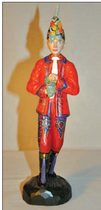
Šohaj ve svátečním kroji, Lanžhot 2021.

Nastrojená dívka v obřadním kroji drží v rukou bábovku, je obutá ve vrapovaných čizmách , na nichž nechybí detail červeného obarvení okraje podrážky i lesklá zlatá podkůvka