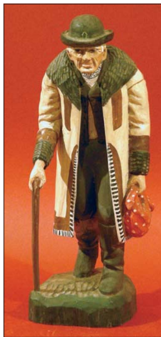
Muž v zimním podlužáckém kroji, Lužice 2008.