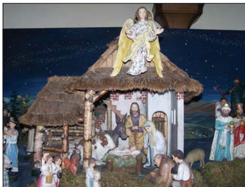
Ústřední betlémská scéna v lužickém betlémě, 2008.

vodní plochy a na horizontu s horským reliéfem. Celkový dojem dotváří vyřezané roubené chaloupky s doškovými střechami na levé straně plochy betléma, architektonicky typické pro podhorské a horské oblasti. Vpravo stojí město připomínající střed Telče. Podle starých fotografií má originální sestava města větší rozsah, než v jaké se instaluje dnes, nestaví se například ani kamenný most. Betlém tvoří téměř 50 lidských a více než 30 zvířecích postav, přičemž antropomorfní figurky jsou asi 27 cm vysoké. Instaluje se na ploše necelých 3×2 m. Ze sledovaných betlémů je druhým s největším počtem figur. Kromě podlužáckého se zde opět mísí stylizovaný lidový oděv obyvatel horských a podhorských vesnic. 35 Na nejstarší fotografii betlému je patrné i uspořádání postav, které se dodnes dodržuje, krojovaní Podlužáci přicházejí zleva od roubených chalup, králové a většinou i pastýři zprava od města. Zajímavostí je, že betlém byl původně taktéž bez podlužáckých krojovaných figur, které později M. Florian doplnil, což dokládá i fotografie betléma z roku 1953. Rodák a dlouholetý kostelník A. Příkaz-