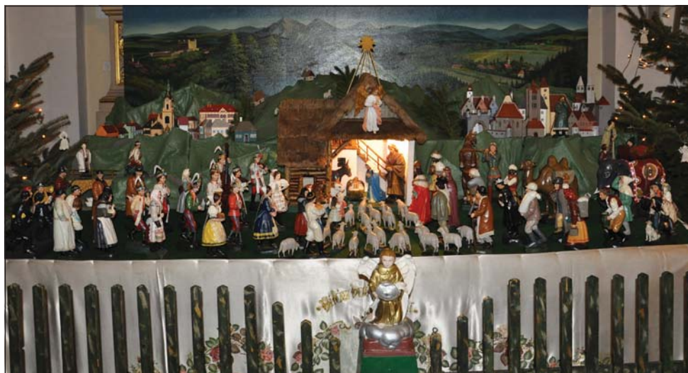
Chrámový betlém v Lanžhotě, 2021.