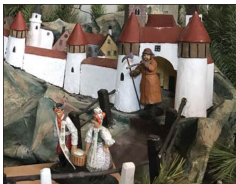
Mladý krojovaný pár ve svátečním podlužáckém kroji, Lednice 2021.