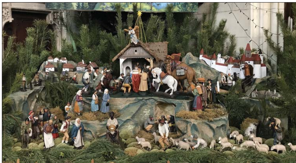
Celkový pohled na lednický betlém, 2021.