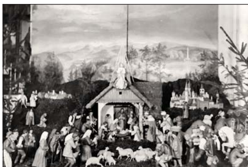
Kostelní betlém v Lednici zachycený zřejmě krátce po svém vzniku. Farní kronika Lednice.