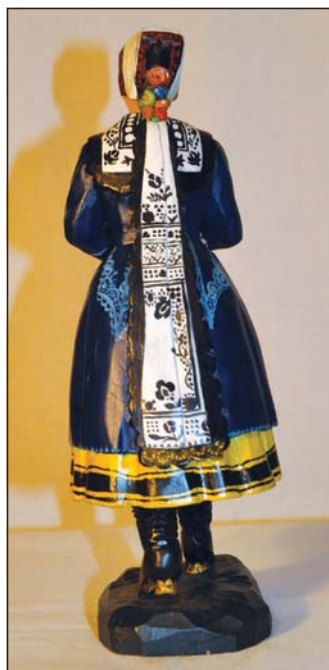
Postava M. Hodonského v lanžhotském betléme, Lanžhot 2021.