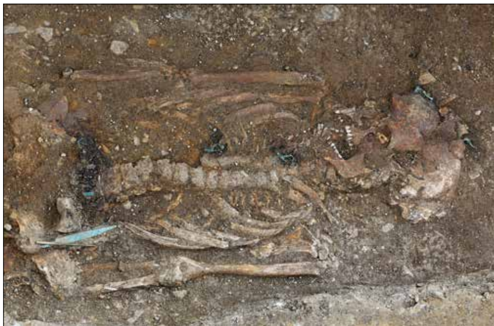
Obr. 2. Kostrový hrob ze starší doby římské v Uherském Brodě.

nesoucí prvky železovské výzdoby. Prozatím registrujeme 69 zahloubených struktur, vzhledem ke stále probíhajícím stavebním pracím však toto číslo nebude zdaleka konečné. Záchraný výzkum se z velké části omezoval na dokumentaci a vzorkování v liniových výkopech. Výjimku tvořil jen plošně zkoumaný úsek o rozměrech 20×2,5 m v SZ části lokality, který byl vytyčen v místech, kde byly zachyceny objekty při svahování a úpravách terénu v okolí nově stavěných bytových domů. V rámci této plochy se podařilo prozkoumat kromě několika menších sídlištních jam téměř kompletní rozsáhlou (13,4 m na délku) stavební jámu nacházející se v bezprostředním okolí dlouhého domu. Z něho se ovšem dochovala jen malá okrajová partie v severní části zkoumané plochy. Na jiných místech areálu se pak podařilo zdokumentovat další, typologicky pestrou škálu sídlištních objektů včetně několika zásobních jam a pecí. Ze zahloubených objektů i kulturní vrstvy pochází velké množství reprezentativního archeologického materiálu, jehož analýza jistě přispěje k poznání neolitického osídlení ve středním Pomoraví.