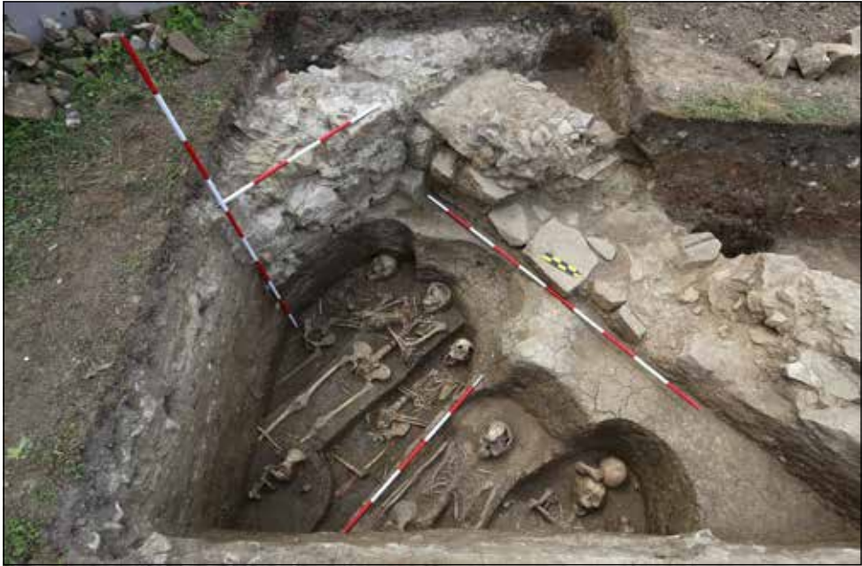
Obr. 3. Plocha výzkumu v areálu dominikánského kláštera v Uherském Brodě.

nůž a kostěnou jehlicí. Další milodary byly uloženy ve výklenku za hlavou zemřelého, který byl bohužel poničen stavební mechanizací. Z těchto milodarů se dochovala jen část jedné keramické nádoby. Spolu s ní zde však bylo uloženo několik dalších fragmentů bronzových předmětů a také dvě bronzové nádoby (pánev a naběračka). Mrtvý byl do hrobu uložen pravděpodobně někdy v závěru 1. století našeho letopočtu. Podle způsobu pohřebního ritu a bohaté výbavy můžeme usuzovat, že se jednalo o příslušníka nejvyšší společenské vrstvy a místní elity. O tom by svědčil i fakt, že většina předmětů, se kterými byl zemřelý uložen do hrobu, byla vyrobena na území římské říše. Jedná se o první bohatý kostrový hrob z tohoto úseku starší doby římské na území Moravy.