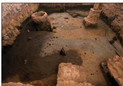
Pohled na část plochy výzkumu v suterénu Základní umělecké školy v Uherském Hradišti.

mat, lze datovat do 2. poloviny 13. století (případně přelomu 13./14. století), tedy do období po založení města Uherské Hradiště. Pod nimi se potom nacházely archeologické situace z období Velké Moravy.