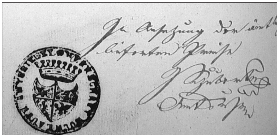
Razítko a podpis vrchního úředníka buchlovského panství z roku 1842 (Moravský zemský archiv v Brně).

příhodu, ale také dobře ilustruje praktické fungování komunikačního systému, kdy vrchní úředník seznámil na správě s novinkami pudmistry, kteří bezprostředně poté předávali informace ostatním spoluobčanům. 32