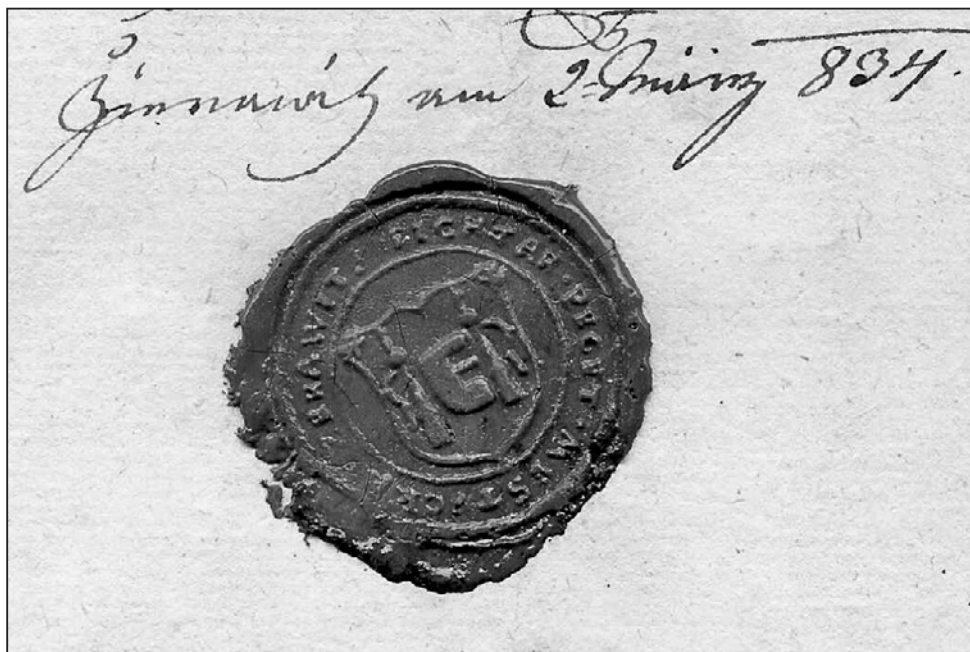
Obecní pečeť Žeravic přitiskšená na smlouvě z 2. března 1834 (Moravský zemský archiv v Brně).

V případě Buchlovic a Břestku nám tedy dochované gruntovní zápisy z první poloviny 17. století vcelku zřetelně rámuji období, v němž započal proces změn ve fungování obecní samosprávy. Již tehdy vzniká úřad purkmistra, teprve později byl pro odlišení od měst pozměněn název na pudmistra. Poté, co se tato funkce etablovala, začala na sebe zvolna strhávat původně rychtářské kompetence, což na druhé straně vedlo až k omezení pravomocí