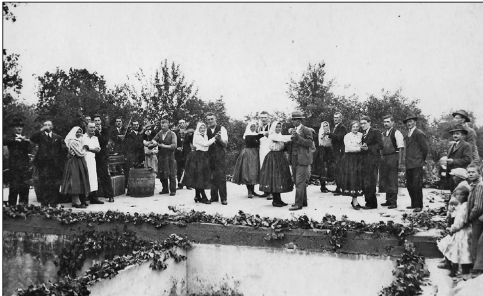
Dedinská zábava nad rozostavanou pivnicou, koniec tridsiatych rokov 20. storočia.

„Že by sme si mohli dovoliť bohvie čo, to teda nie, možno trochu oblečení a upravení sme chodili inak, ale to bolo preto, že mama bola učiteľka a veľmi na nás dbala. Všetky peniaze sa točili vo firme. Aj chalupy si všetci robotníci postavili skôr ako my. Posledné peniaze, čo sme mali, boli po vojne, otec dostal ako náhradu za vojnové škody asi 100 tisíc korún. Aj tie vrazil zase do zveladenia pivnice a v chalupe zas nič neostalo. Ale jemu ani tak nešlo o to víno, ale