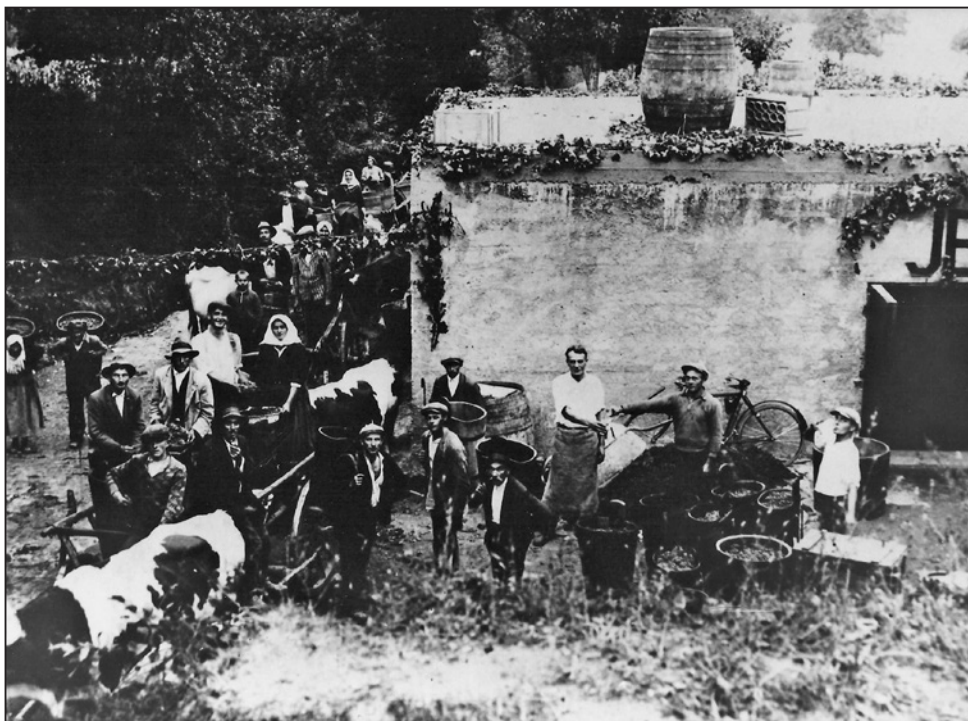
Predaj hrozna pred pivnicou, štyridsiate roky 20. storočia.