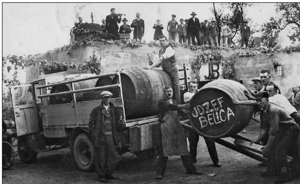
Prešári, plničí, šoféri – nájomní robotníci počas prešovania hrozna, 1946.

o propagáciu kraja, regiónu, vína. On to víno ani poriadne nepil. To chcel keby býval mohol, propagovať kraj a kultúru. To, čo teraz propagujú ako vidiecku či vínnu turistiku, môj otec realizoval už v tridsiatych rokoch.“