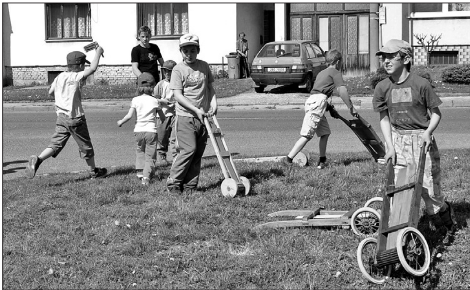
Skupina Dědina o přestávce. Radějov 22. 4. 2011.