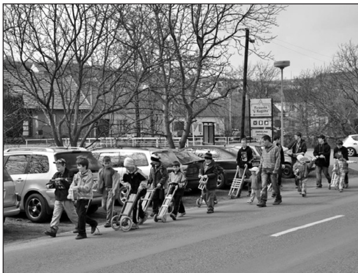
Skupina Dědina při klepání na Bílou sobotu. Radějov 7. 4. 2012.

Začíná se tradičně u bunkru na začátku Záhumní ulice. Začátek je stejný se skupinou Hošťáky, dále ale Kopečtí postupují svou cestou a s druhými skupinami ztrácejí kontakt. Aby obešli všechny obydlené domy na svém území, čeká klepáče u penzionu Queen bar první odbočka do kopců, a to do ulice Drahy (viz mapa). Menší děti spolu se stárkem a mládkem v její půlce vyčkávají, zatímco starší klepou až do konce, tzv. doklepávají , a poté se vracejí zpět. Za doklepávání konců ulic jsou plusové body. Přibližně před desíti lety ještě fungovala zkratka vedoucí z půli ulice Drahy na začátek Třešňovců, dnes se však klepáči musí vrátit ke Queen baru, pokračovat ulicí Kopce a teprve potom odbočit od Třešňovců. Na jejich konci je přestávka, kde současný stárek zapisuje docházku. Nedaleko odsud je na okraji lesa studánka, u které se chlapci můžou napít. Skupina se poté Třešňovci vrací zpátky, když ujede asi dvě třetiny délky ulice, přechází lesní pěšinou na konec další uličky (při přecházení se neklepe) ústící na asfaltku v ulici Kopce. Po ní se postupuje stále nahoru až k místu před koncem trasy, kde je v současnosti vybudována vedle silnice rovná plocha sloužící jako soukromé parkoviště. Zde je druhá pauza. Mladší děti, stárek a mládek zůstávají, starší doklepávají k posledním domům. Klepáči se pak otáčejí a hrkají k ústí ulice Třešňovce, kde obchůzku stárek ukončí. Stejně jako u ostatních skupin již poté nikdo klepat nesmí. Svižnějším tempem její absolvování zabere asi hodinu.