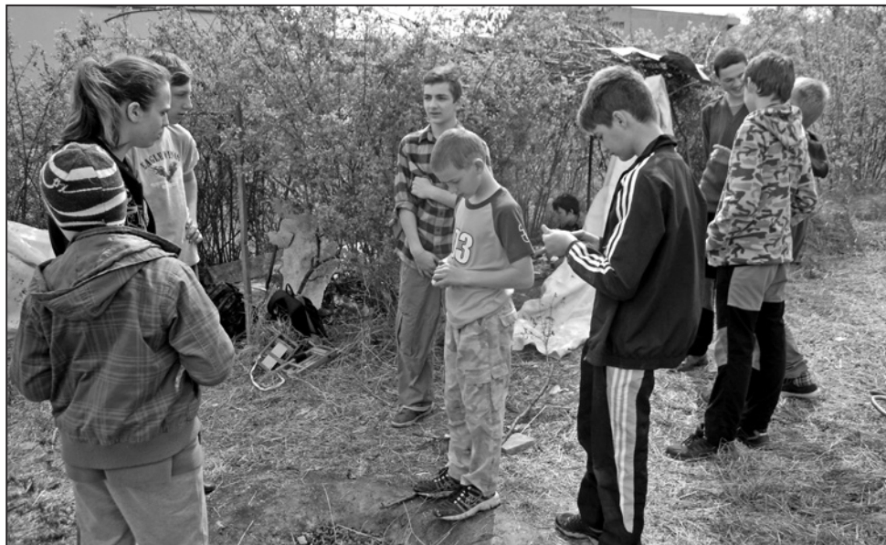
Klepáči z Kopců u bunkru před poledním klepáním na Bílou sobotu. Radějov 19. 4. 2014.

Podoba a provedení bunkrů jednotlivých skupin se přizpůsobovala terénu a aktuál-