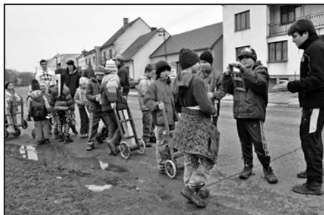
Řazení skupiny Dědina na jedné ze svých zastávek. Radějov 30. 3. 2013.

mladších chlapců. Ti běží po trase ve tvaru smyčky nejprve po hlavní silnici kolem hájenky, na konci Radějova zahýbají doprava a přebíhají na vedlejší ulici v Potokách, tou se vrací zpět k ostatním. Skupinka celou cestu musí utíkat, na což dohlíží klepáči schovaní podél trasy. Pokud by běžící něco ošidili, hlásí to stárkovi. Protože některé úseky vedou náročnějším terénem, klepe se jen řehtačkami a kladivky. Po doběhnutí skupinky klepání končí a účastníci se rozchází. Jedna obchůzka kolektivu z Dědiny trvá přibližně půl hodiny. 65