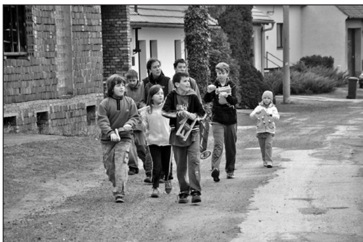
Skupina Hoštáky při klepání na Zelený čtvrtek. Radějov 5. 4. 2012.