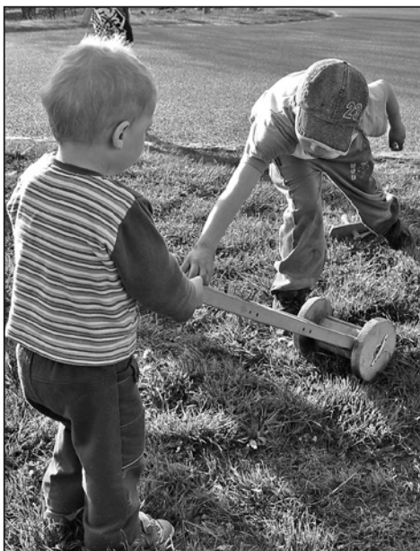
Tahanice o táčky, skupina Dědina. Radějov 22. 4. 2011.