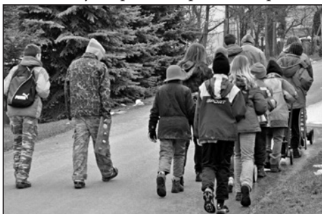
Klepání skupiny Kopce na Bílou sobotu, vzadu vlevo dohlíží stárek s mládkem. Radějov 30. 3. 2013.

Každému věku a z toho plynoucím odchozeným létům klepání přísluší určitý klepací nástroj. Jak již bylo řečeno, nejvýznamnější jsou u skupiny Kopce hrušky , náležející stárkovi. U nejstarší generace však platily za běžný nástroj, a to v pořadí druhý nejdůležitější. V současnosti se na Dědině i v Hoštákách výjimečně také objevují, věk a postavení jejich nositelů v rámci kolektivu je však libovolný. Táčky jsou tradičně určeny mládkovi a stárkovi, popřípadě dalším nejstarším klepáčům. Jsou nejhlučnějším, a tudíž nejprestižnějším klepadlem. K táčkám se měl člověk propracovat. Protože však jsou tak žádané, domáhá se jich v současnosti mnoho dětí a jejich věk a zásluhy často nejsou zohledňovány. Táčky mají podobu trakaře. Na společné ose s kolečkem trakaře jsou umístěna ozubená kola, která při otáčení narážejí na dřevěné desky s funkcí pružiny. Výška tónu závisí