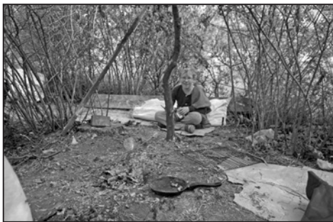
Přírodní bunkr skupiny Kopce. Radějov 19. 4. 2014.