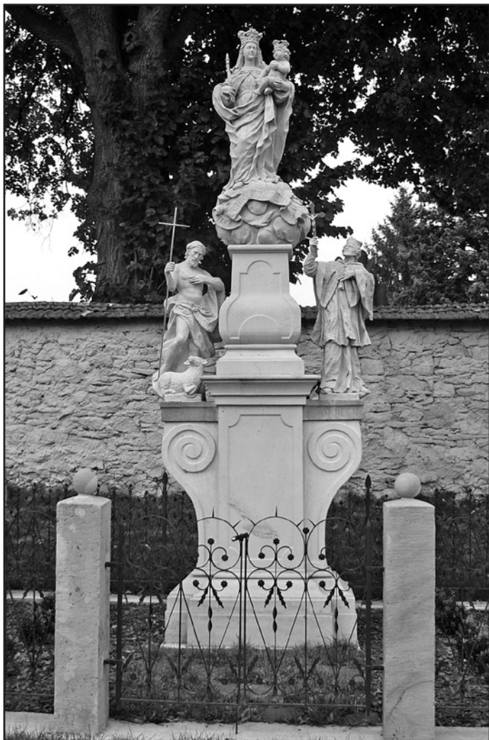
Křenov, sousoší Panny Marie Kladské na novém místě u kaple sv. Isidora, 2013.

Sousoší má spodní sokl s profilací, na něm posazený střední hranolový podstavec, ke kterému jsou připojeny dvě obrácené voluty sloužící za sokly asistenčních soch svatých Janů. Centrální figura Panny Marie s Ježíškem na levé ruce a žezlem v pravé ruce je postavena ještě na dalším soklíku hruškovitého tvaru. Pod nohama má oblačnou sféru z přední strany opatřenou zvláštnou nápisovou páskou. Dnes jsou některá písmena těžce čitelná a jiná nejspíše přesekaná. Dříve byla oblaka ještě po stranách doplněna andělickými postavami a hlavičkami. Samotná socha Panny Marie dobře sleduje vzor milostné mariánské sochy z Kladska. Byla zřejmě vytesána podle nějaké lehce dostupné předlohy. Kromě poutních obrázků mohl mít sochař k dispozici také