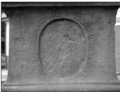
Březolupy, socha sv. Jana Nepomuckého, detail nápisu na podstavci, 2012.