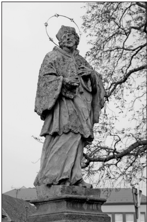
Březolupy, socha sv. Jana Nepomuckého, detail světecké sochy, 2012.

ověřit, že socha byla umístěna mezi potokem a cestou na parcele označené číslem 236. 11 Stála mimo vesnici za domy u komunikace vedoucí po levém břehu potoka do Bílovic a dále do Uherského Hradiště. V době mapování stabilního katastru byl okolní pozemek využíván jako obecní louka. Vodítko k odpovědi, proč byla socha postavena právě zde, nám schází. Za to její přesun byl poměrně logický. Světec pravděpodobně začal ohrožovat rozrůstající se sad, a proto získal důstojnější pozici u mostu na návsi. Mladé stromky zase naopak ohrožovali věřící, kteří se u sochy tradičně několikrát ročně scházeli. Pobožnosti u světeckých figur Jana Nepomuckého v oblasti Uherskohradištska probíhaly v předvečer svátku sv. Jana, někdy též na sv. Marka při vyprošování dobré úrody, při velikonočním klepání se zde zastavovali chlapi, probíhaly tu také májové pobožnosti nebo se u soch stavěl oltářiček na slavnost Božího těla. 12