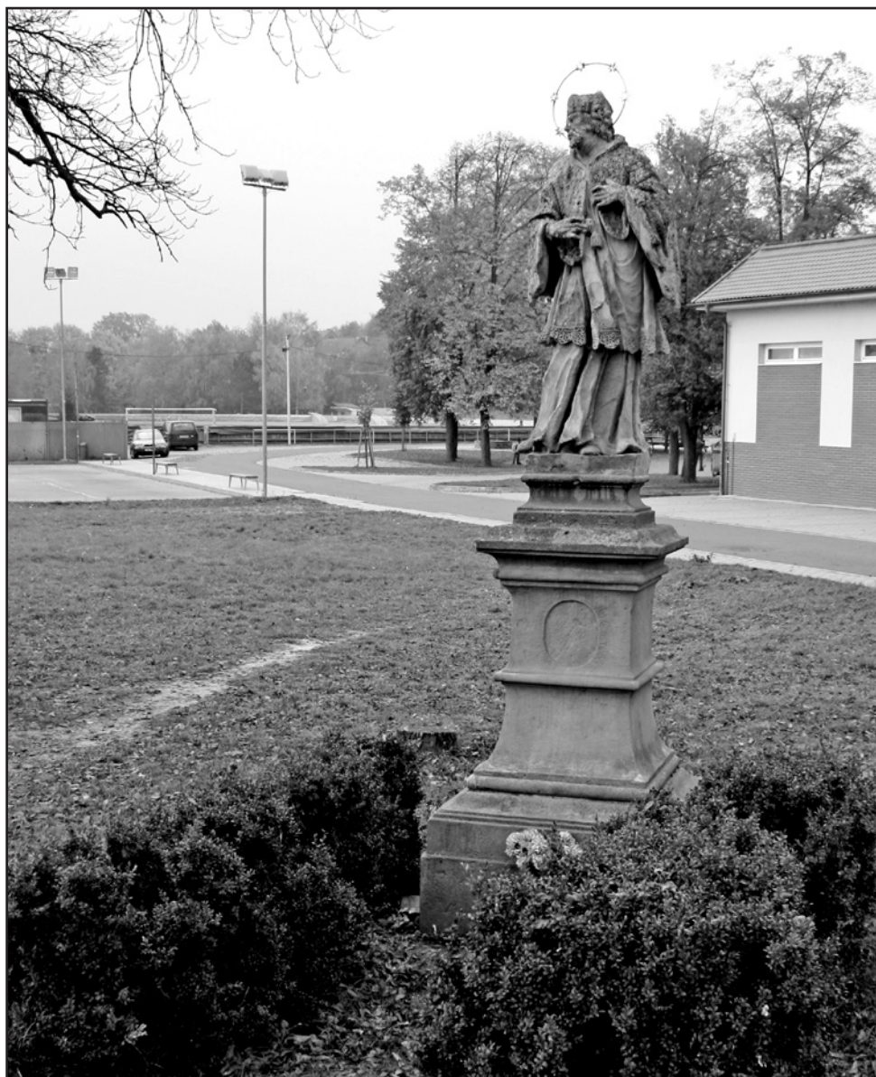
Březolupy, socha sv. Jana Nepomuckého, 2012.

Dnes socha stojí ve středu vesnice „Na Rybníčku“ v blízkosti mostu přes potok Březnický. Ačkoliv by situování sv. Jana Nepomuckého u mostu či na mostě napovídalo, že se setkáváme s historickým umístěním, na starších mapách zde není žádná socha vyznačena. Sv. Jan sem byl přesunut až druhotně, což ostatně dokládají i písemné prameny. V zápisech obecní