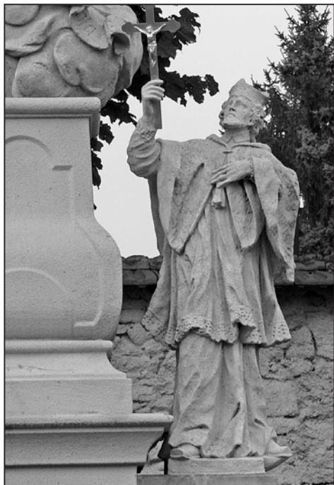
Křenov, sousoší Panny Marie Kladské, detail sochy sv. Jana Nepomuckého, 2013.