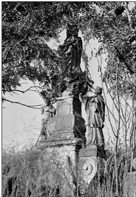
Křenov, sousoší Panny Marie Kladské na původním místě u cesty na Šnekov, 1962. Fototéka NPÚ-ÚOP Pardubice.

O rok mladší sousoší postavené v Křenově u Moravské Třebové 16 také nejspíš vzniklo v dílně Antona Rigy. Kombinuje centrální postavu Panny Marie Kladské se sv. Janem Křtitelem a sv. Janem Nepomuckým. V současnosti je sousoší postaveno před hřbitovní kaplí sv. Isidora, kam bylo přeneseno v nedávné době. Socha původně stála kousek za městečkem u cesty vedoucí do Šnekova