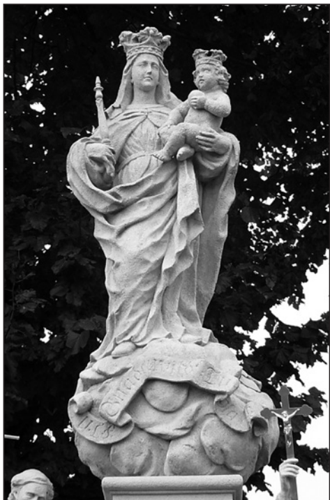
Křenov, sousoší Panny Marie Kladské, detail vrcholové sochy Panny Marie, 2013.