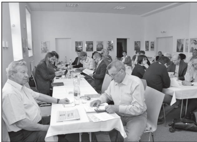
Účastníci agrární konference, Uherské Hradiště 2012.

Ale ohlédnou-li se pořadatelé** (připomenu, že vedle Slovákckého muzea k nim pravidelně náležel Historický ústav AV ČR, Masarykův ústav a Archiv AV ČR a Odborový svaz pracovníků zemědělství a výživy Čech a Moravy – Asociace samostatných odborů, Praha), mohou být zajisté spokojeni. Promyšlená koncepce agrárních konferencí se nakonec odráží i v jednotlivých názevech. V roce 1992 to bylo