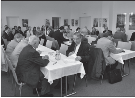
Vědecký seminář Češi a Slováci 1993–2012, Uherské Hradiště 2012.

národy nespojila, ale vždy ich len rôznym spôsobom rozdelila.