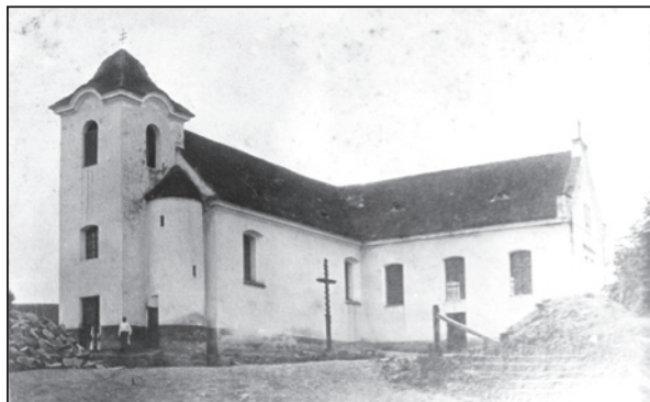
Starý vnorovský kostel zbořený roku 1908, konec 19. století.