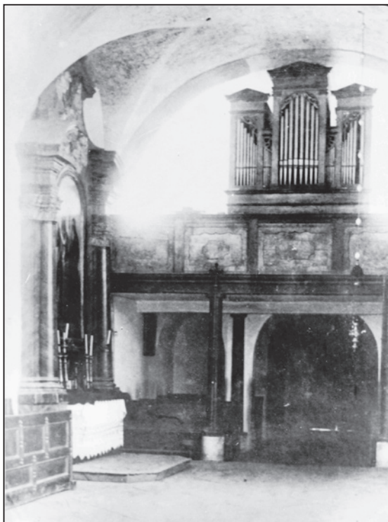
Varhany ve starém vnorovském kostele z 18. století, konec 19. století.

Jak vyplývá z výše uvedeného přepisu, nebyla v té době služba rektora nijak pevně honorována. Zajisté se někteří farníci rádi ukázali v dobrém světle a rodině rektora výsluhou přispěli na živobytí. Šlo však o skutečnou službu, která byla společenským doplňkem školního