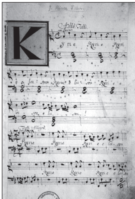
Harmonia Pastoralis, P. Jiří Josef Zrunek, OFM, 18. století.

Psal se rok 1736, uplynula čtyři léta od znovuzavedení duchovní správy prostřednictvím lokálního kaplanství ve Vnorovech (tehdejších Znorovách) na panství Veselí nad Moravou. Během těchto čtyř let se vystřídali v nově postavené vnorovské kurácii tři lokální kaplani. Pro Vnorovy a jejich obyvatele to nebyla lehká doba. Po bouřlivém 16. a první polovině 17. století, kdy byla obec a s ní i kostel několikrát téměř zničen, byl chátrající vnorovský