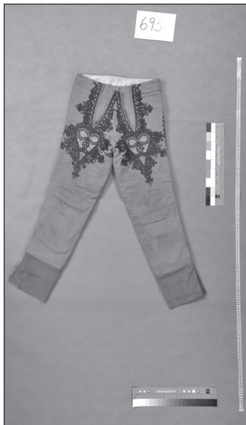
Kalhoty-nohavice, Dolní Bojanovice (inv. č. 6939).

Pozornost badatelů v minulosti upoutávaly odlišnosti jednotlivých krojových součástí: „Z moravskoslovenských krojů, které se dotýkají našich hranic, nejrůznovější jsou podlužácký, hornácký (velický) a kopaničářský ze St. Hrozenkova; ale i ostatní kroj (strážnický a straňanský) nejsou bez pozoruhodných krás.“ 35 V případě Podluží k tomu přispívaly jistě i červené