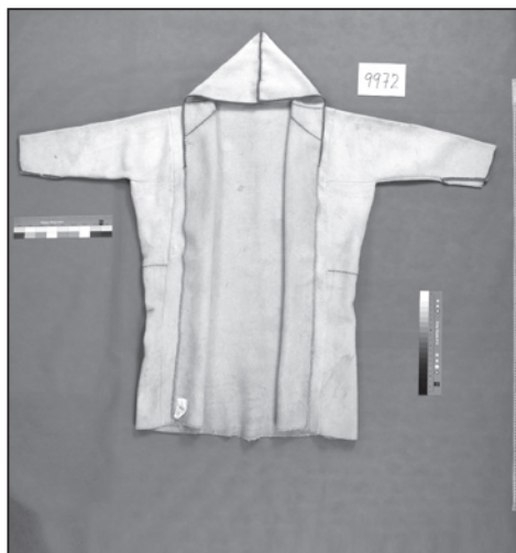
Kabát-halena, Mokřý Háj (inv. č. 9972).

(inv. č. 22951) bez určeného místa původu je téměř totožná s halenou (inv. č. 2085) z Velké nad Veličkou.