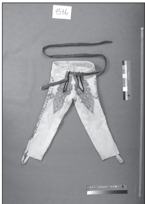
Kalhoty-nohavice, Vápenice (inv. č. 1516).

Z kopaničářské obce Vápenice pocházejí soukenné kalhoty (inv. č. 1516) ušité z bílého