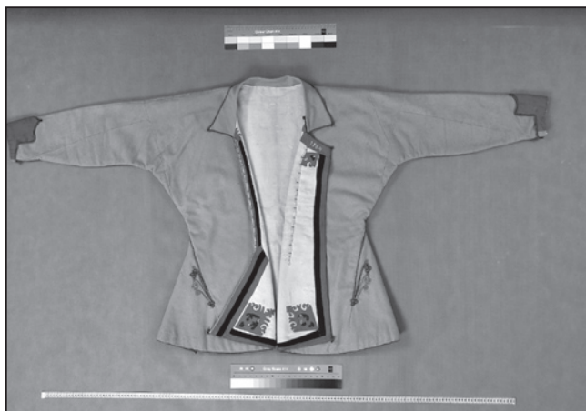
Kabát, Velká nad Veličkou (inv. č. 1312), datace 1904.