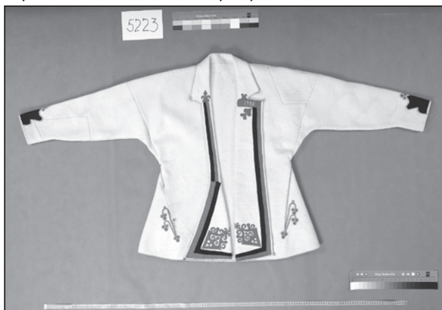
Kabát, Kuželov (inv. č. 5223), datace 1922.

Nejvíce příkladů pochází z obcí Javorník, Velká nad Veličkou a Kuželov. Jedním exemplářem je zastoupena i obec Nová Lhota. Několik kabátů má na klopě přednice vyšitú dataci, na třech bílých kabátech jsou to roky 1904 (inv. č. 5224; z Kuželova), 1918 (inv. č. 22756; z Velké nad Veličkou) a 1922 (inv. č. 5223; z Kuželova). Světle modrý kabát, jediný ve sbírkovém fondu, je datovaný rokem 1904 (inv. č. 1312). Ostatní kabáty tohoto typu jsou nedatované, na jejich stáří lze usuzovat hlavně z provedení výzdoby, pro kterou jsou charakteristické soukenné aplikace v podobě stylizovaného srdce a květu na