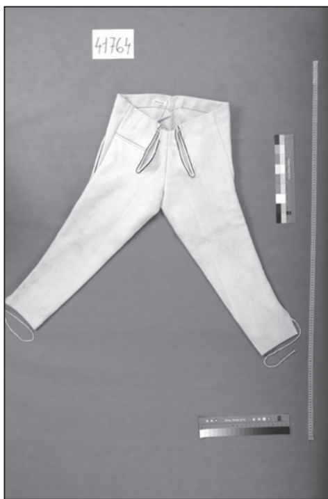
Kalhoty-nohavice, Velká nad Veličkou (inv. č. 41764).

Velmi blízký horňáckému je sousední кроj senicko-myjavský, jak celkovou podobou, tak i v detailech a názvosloví. Jan Húsek se zmiňuje o zdejších nohavicích černých s černým šňůrováním a krátkým remenem. 32 Z obce Vrbovce pochází kalhoty (inv. č. 19532) ušité z tmavě modrého sukna zdobené skromným černým šňůrováním. 33 Ačkoliv očekáváme střih se samostatným sedlem, kalhoty jsou ušity se sedlem, které tvoří samostatný díl společný pro přední i zadní část kalhot. Tato střihová konstrukce soukenných kalhot se objevuje i na Horňácku, jak dokládají například i světle modré soukenné kalhoty z tohoto regionu uložené ve sbírkách Moravského zemského muzea v Brně 34 a také dva exempláře ve sbírkách NÚLK (inv. č. 23009 a inv. č. 46833). U prvních se jedná o blíže nelokalizované kalhoty