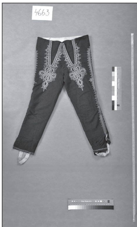
Kalhoty-nohavice, Kátov (inv. č. 4663).