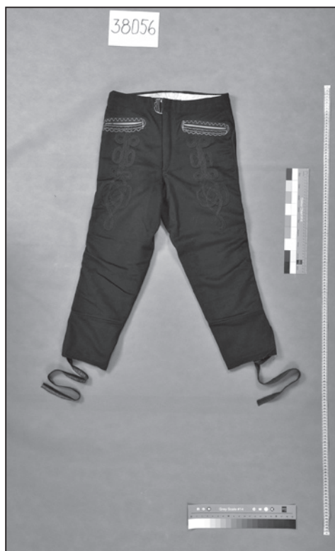
Kalhoty-nohavice, Petrov (inv. č. 38056).

Mezi dolňáckými mužskými soukennými součástkami z Uherskohradištska je na první pohled rozpoznatelný кроj kunovického krojového okrsku, který má ve sbírce NÚLK svého zástupce. Nohavice (inv. č. 5363) z tmavě modrého sukna jsou velmi hus- tě světle modře šňůrované „...kamrholovými šňůrečkami...“, toto „...malování na větší vzdálenost činí dojem dvou jednodolých, světle modrých, kosníkových obrazců v předu ko- lem poklopce.“ 49 Stříhově se neliší od výše zmíněných kalhot ze Starého Města. Ve stříhu sedla, které oproti předchozím dvěma exemplářům tvoří na zadku kalhot samostatný díle, se odlišují třetí soukenné kalhoty z uherskohradištského Dolňácka – z Domanína