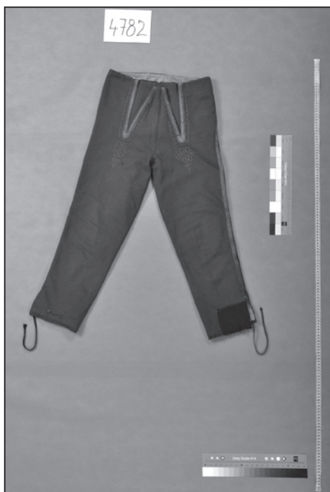
Kalhoty-nohavice, Rohatec (inv. č. 4782).

moravsko-slovenským městem, kde se nosil „...selský kraj...“, jehož součástí byly i mužské soukenné kalhoty černé „...modrými nebo černými haraskami nepřilíš bohatě šňurovány.“ 46 Všechny kalhoty ze Strážnice – sbírka obsahuje šest kusů – jsou totožné stříhové konstrukce s délkou po kotníky, vedením švů na nohavici po boční straně nohy, s rozparky po stranách krokového švu a bez sedla na zadku kalhot. Vyrobeny jsou z tmavě modrého až černého sukna vycházejícího z místní soukenické produkce a jsou ozdobeny jednoduchým černým šňurováním, svým hnědým šňurováním se od ostatních odlišují pouze jedny kalhoty (inv. č. 3875). I pro mužský kraj sousední obce Petrov je charakteristická tmavě modrá barva sukna. Dříve se zde soukenné kalhoty šily stejného střihu jako ve Strážnici – se dvěma rozparky a sedlem na zadku kalhot, později však došlo k proměně stříhové konstrukce. Novější varianta kalhot, zastoupená ve sbírkách pěti exempláři, je bez sedla a s vedením švů na nohavici po boční straně nohy a jedním rozparkem v krokovém švu. Přestože zmizely dva rozparky v pase kalhot, šňurování na nohavicích zůstává zachováno a je provedeno v černé barvě. Charakteristickým znakem kalhot jsou vodorovné výpustkové kapsy ozdobené jednoduchou strojovou červenožlutou výšivkou, kapsa je vevnitř podložena červeným sukem. V detailu se liší pouze kalhoty (inv. č. 6), které přibýly do sbírek v roce 1979. Kapsy jsou v tomto případě bez výšivky a pouze olemované zoubkovaným sukem.