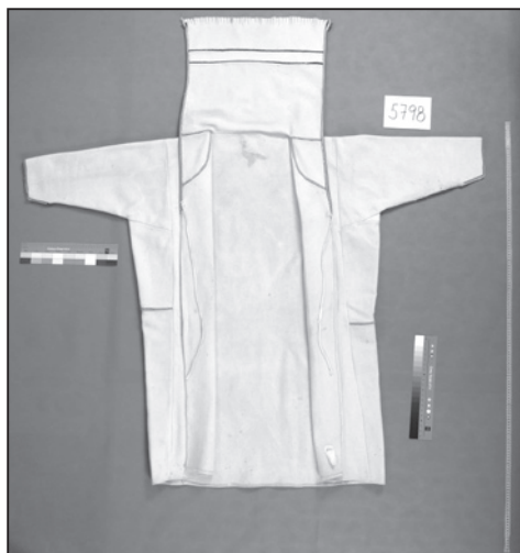
Kabát-halena, Hluk (inv. č. 5798).