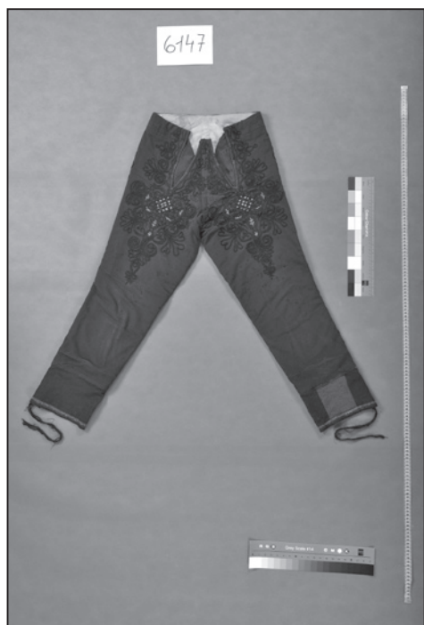
Kalhoty-nohavice, Ratiškovice (inv. č. 6147).