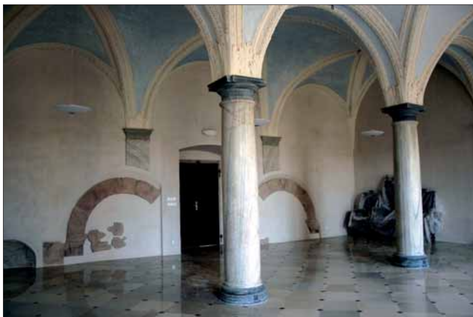
3. Kapitulní síň – současnost (prosinec rok 2007).