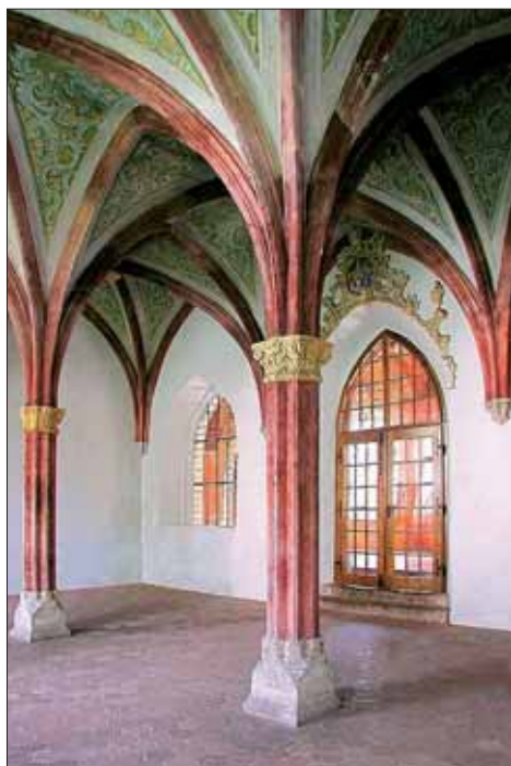
8. Kapitulní síň kláštera Zlatá Koruna.

Součástí rehabilitace prostoru bylo pověšení dvou obrazů, jimiž disponuje Římskokatolická farnost Velehrad. Na levé straně západní stěny kapitulní síně byl instalován portrét velehradského opata Jana VI. Škardonida. 69 Obraz vytvořil patrně jezuitský malíř Ignác Raab. 70 Opat je na plátně vyobrazen z pravého profilu, oděn do černého šatu s křížem na prsou, s bílými manžetami a límcem. Na hlavě má černou kulatou čepičku. Kolem je iluzivní oválný rám, částečně zahalený šedofialovou drapérií s nápisem: REVERENDISS(imus) DOM(inus) IOANNES VI COGNOM(ine) SKARDONIDIS ABBAS WELEHRADENSIS. XL. Pod portrétem je nápis: ANNO 1605 IN HUNGARIA, HAERETICORU, ET TURCARU GRASSANTE, PRAESERTIM IN PERSONAS DEO SACRATAS PERSECUTIONE, V(enerabilis) P(ater) LUDOVICUS DE ANGELIS, CU(m) F(ratre) CLER(ico) MICHAELE A SZILÁGY SOMLYO. EX ALMA NOSTRA PROVINCIA SALVATORIANA, CONFUGIT WELLEHRADIU(m), ET AB HOC RRmO (reverendissimo) D(omino) ABBATE BENIGNO SUSCEPTI ANIMO, SINGULARI A RELIGIOSIS WELLEHRADENSIBUS FOVEBANTUR CHARITATIS AFFECTU. TANDEM SUPRA FATO A(nno) 1605. 19. MARTY, A Dom(ino) (P.T.) IOANNE PUREK, HRADISTII PRIMATE, CAETERISQUE, TUNC TEMPORIS VIX DUODECIM CIVIBUS CATHOLICIS WELLEHRADIO HRADISTIUM DEDUCTI, ATQUE AD CAPIENDAM, A 63 ANIS DESERTI HUIJUS SERAPHICI, ANNUNTIATAE B(eatae) V(irginis) M(ariae) DEDICATI HRADISTIENSIS CONVENTUS, POSSESSIONEM. CUM ALIQUIBUS SZAKOLCZA, ET GALGOCZIO EXTURBATUS PATRIB(us) INDUCTI FUERUNT.