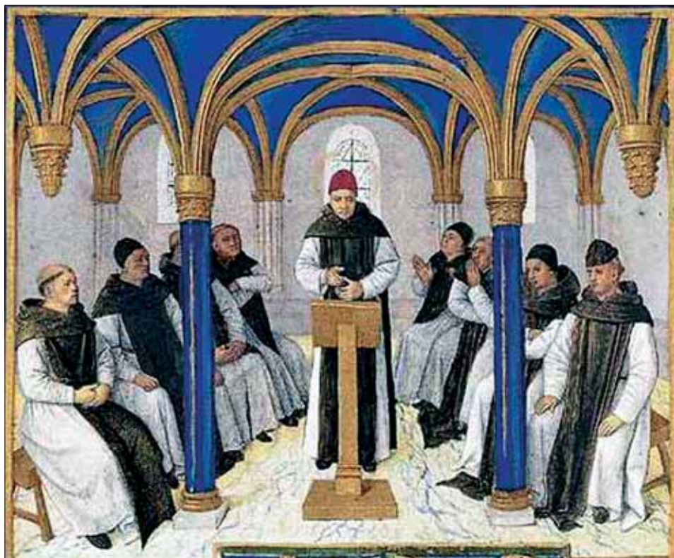
7. Sv. Bernard káže mnichům v kapitulní síni v Clairvaux – Malba od Jeana Fouqueta (1420–kol. 1481) Publikováno in: KORUNA, Bernard: Cisterciáci. Horní Dvořiště 1948.

korunována rozetami s vegetabilními motivy. Pole klenby jsou bledě modrá s valérovými a texturními odstíny a dávají tak kapitulní síni až kosmologický rozměr. 64 Tuto modelaci prosadil restaurátor M. Slovák s ohledem na to, že uniformní monochromní nátěr by byl sice technicky uspokojivý, ale navozoval by impresi prázdna. Použití barvy dokumentované teprve v mladších vrstvách v jistém smyslu odporuje původní cisterciácké ideji, nicméně je legitimizováno fyzickou existencí zhmotněného díla v čase, „kde se také barva stává jeho existenciální charakteristikou.“ 65