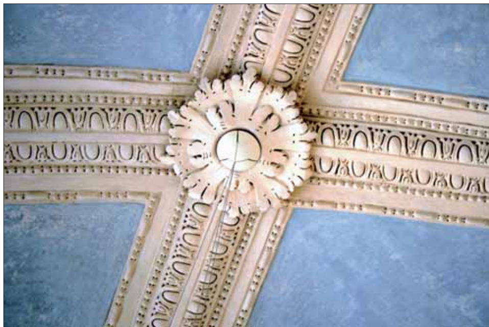
5. Detail štukové výzdoby.