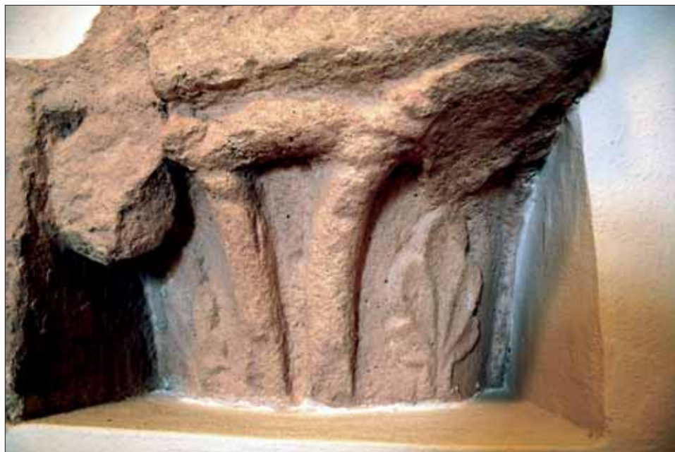
6. Hlavice jednoho z románských oblouků.