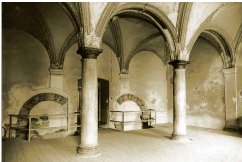
2. Kapitulní síň – stav v roce 1937.