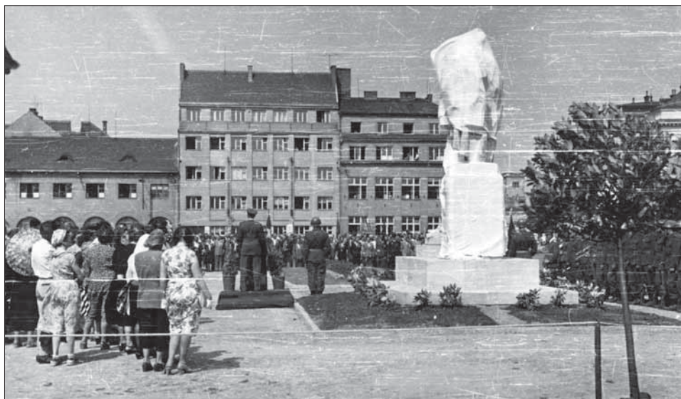
6. Slavnostní odhalení památníku obětem druhé světové války 7. července 1957.

pohřbených vojáků i nadále odpočívají v půdě mařatického hřbitova. Vzhledem k tomu, že byl zásadně změněn tvar i značení sektorů, nelze dnes přesně určit místo posledního odpočinku konkrétních osob, ale pouze s jistou mírou přesnosti přibližnou lokalizaci. Posledním němým mementem vojenského hřbitova je dosud stojící prázdný podstavec původního legionářského pomníku, stísněný mezi hroby.