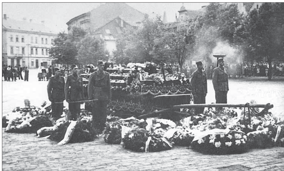
3. Vůz s urnami při smuteční slavnosti 18. března 1947 na Masarykově náměstí.