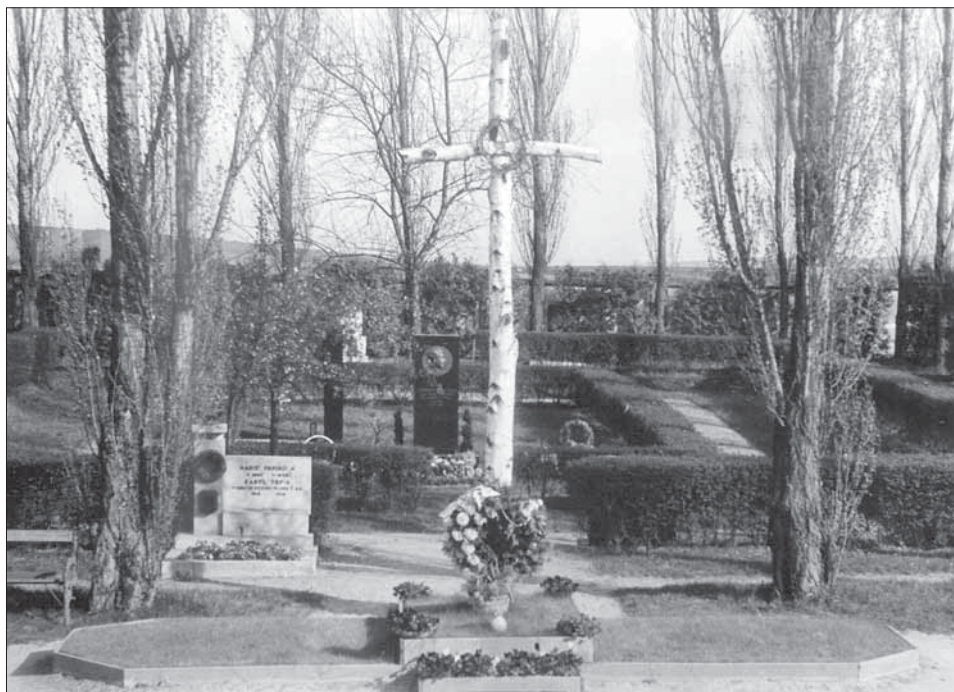
4. Kolumbárium obětí nacistické perzekuce na hřbitově v Mařaticích.

Ačkoli se tedy zdálo, že stavbě nestojí nic v cestě, realizace projektu se z ničeho nic zastavila. Nejpravděpodobnější příčinou se zdá být měnová reforma, jež v červnu 1953 uvrhla Československo do ekonomické stagnace. Nejen obyvatelé, ale i veřejné rozpočty měly náhle hluboko do kapsy, a tak nebyla vyhlídka na získání prostředků ani z veřejných sbírek, ani z dotací či městských financí. Byla to ale opět místní jednota Svazu protifašistických bojovníků, kdo se s neutěšenou situací kolem památníku nehodlal smířit. Začala obesílat všechny možné úřady a organizace emotivními žádostmi o intervenci ve prospěch jejich věci. 43 Kritizuje zde město, jež odmítlo převzít úlohu přímého investora, a pozastavuje se nad skutečností, že ve městě nebyl tak dlouho po válce vybudován důstojný památník 9 padlých rudoarmějců a 80 popravených a umučených občanů města, jejichž urny „ rezaví v ubohém betonovém sklepe, kterému se říká hrobka “. 44 V této korespondenci se také poprvé zmiňuje myšlenka