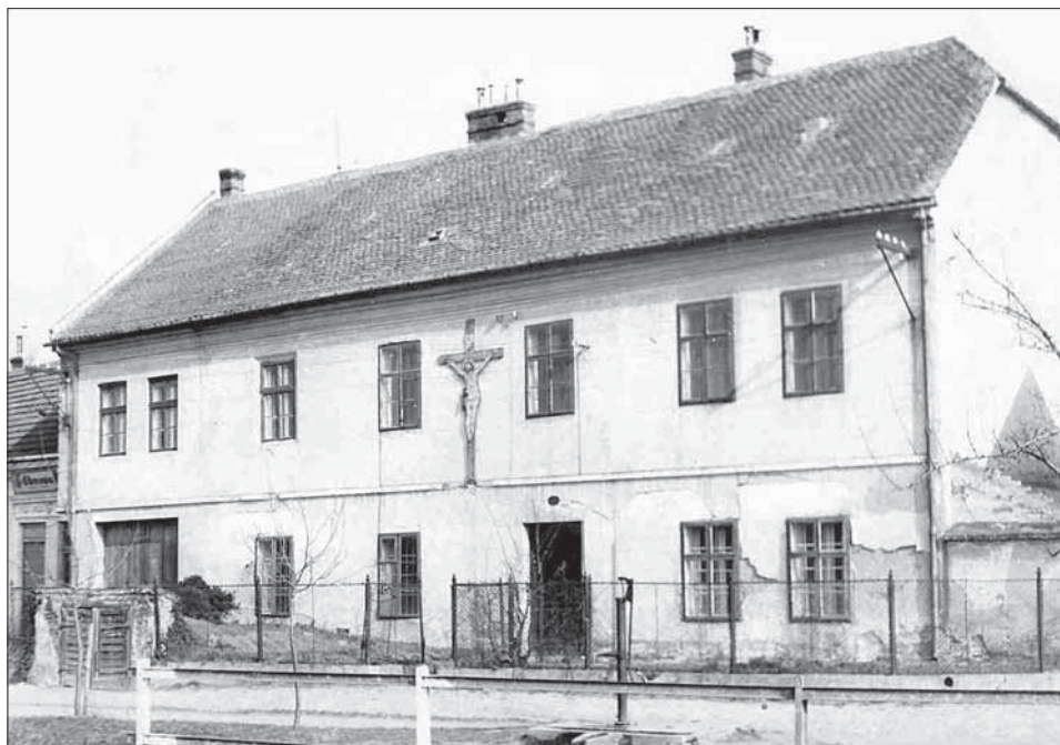
Fara v Ostrožské Nové Vsi v první polovině 20. století.