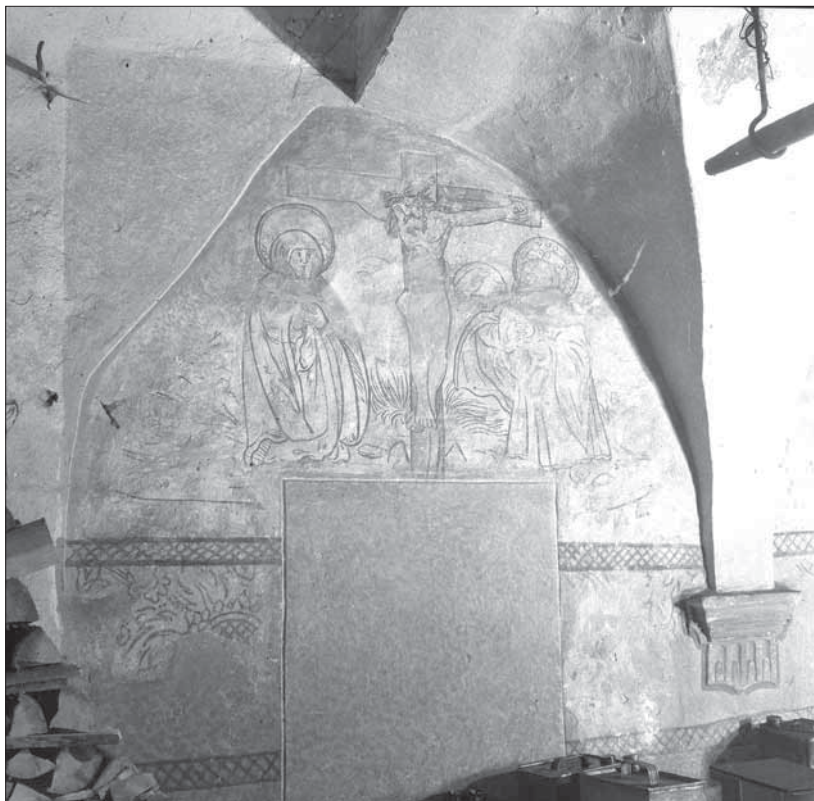
1. Pozdněgotická freska v někdejší tzv. Kunovické kapli.