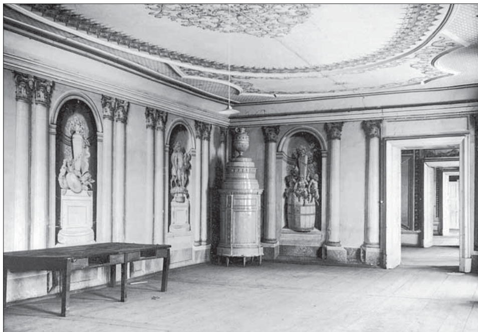
3. Výzdoba hlavního sálu v prvním patře. Nedatováno (patrně první polovina 20. století).