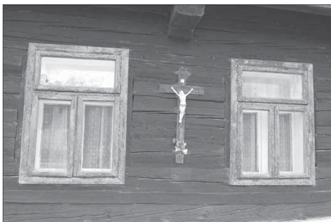
Nedašov, průčelí s dřevěným křížem u štítově orientované roubené usedlosti čp. 16.

usedlostí. Kromě obytných částí s původním členěním interiérů i jejich nábytkovým vybavením a topeništěm lze nalézt chlévy se stánkami pro dobytek, rozměrné stodoly, někdy i s hospodářským vybavením. V zástavbě dvorů se nachází i patrové komory, v zahradách za domy se někde nalézají sušírny na ovoce, včelíny. V některých lokalitách zástavbu doplňují i samostatné hospodářské sklepy nebo pece na pečení chleba. Volně v krajině jsou zasazeny drobné sakrální objekty – ve zdejší oblasti jsou to především různými typy křížů, méně často kapličky. V návesních prostorách se ojediněle zachovaly také drobné technické stavby – kovářny.