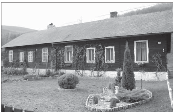
Sidonie, kolonie roubených domů čp. 46–49.