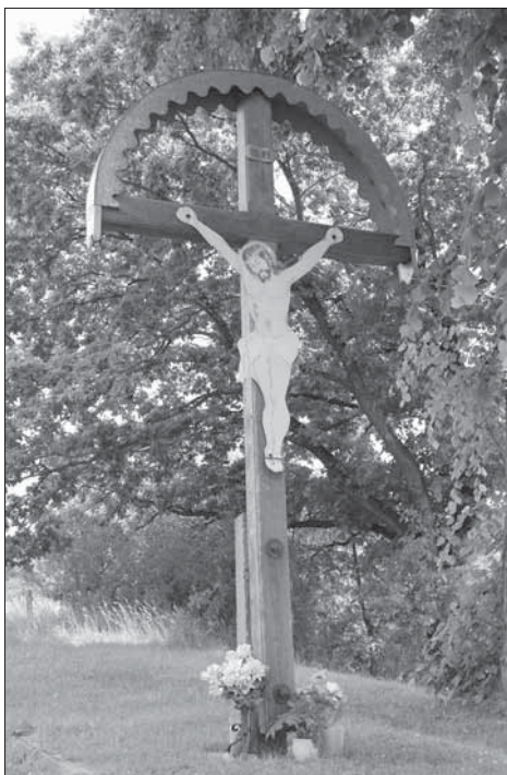
Vrbětice, dřevěný kříž s plechovým kolorovaným korpusem Krista při polní cestě za obcí.