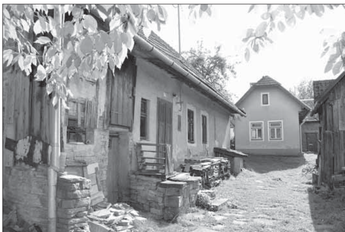
Šanov, domkářská zástavba u potoka.

by obce tvoří nepravidelně situované domy se společnými dvory a vedle sebe či za sebou umístěnými soubory stodol.