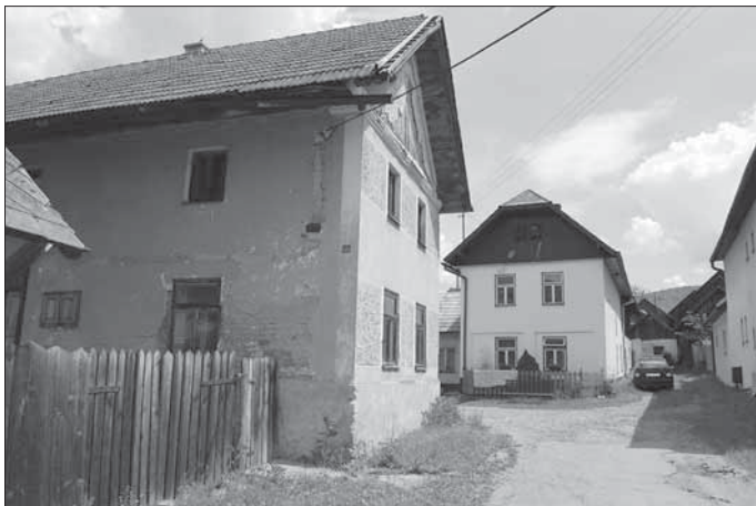
Vrbětice, patrové usedlosti v hromadné zástavbě společných dvorů, v popředí čp. 27.