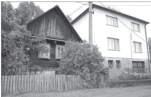
Nedašova Lhota, roubená usedlost čp. 27 v kontrastu se sousední novodobou stavbou.