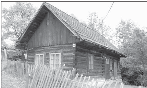
Nedašova Lhota, obydlená roubená chalupa čp. 108.