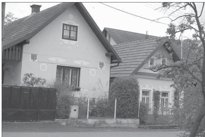
Nedašov, štítové domy s novodobou štukovou výzdobou.