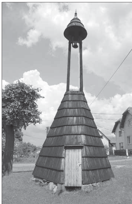
Vrbětice, dřevěná zvonice.