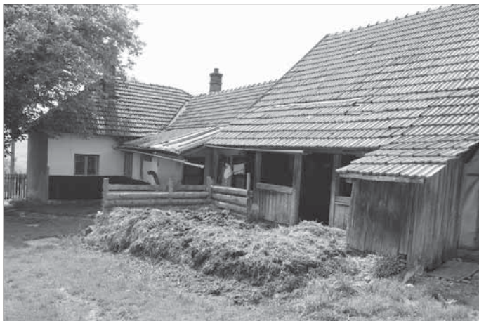
Popov, zástavba dvora pasekářské usedlosti čp. 69. Chlévy kryté polootevřeným podsíňkem se suchým záchodem u hnojiště.