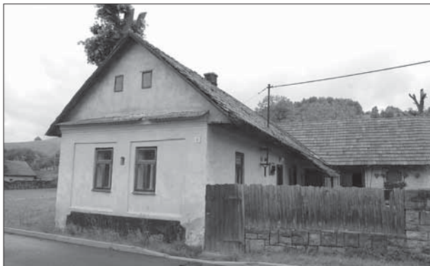
Nedašova Lhota, zděná usedlost čp.1 s trojbokou zástavbou dvora otevřeného do veřejného prostoru.