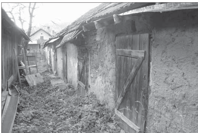
Sidonie, soubor chlévů při kolonii domů čp. 65.