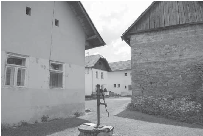
Vrbětice, hromadná zástavba domů uprostřed obce.