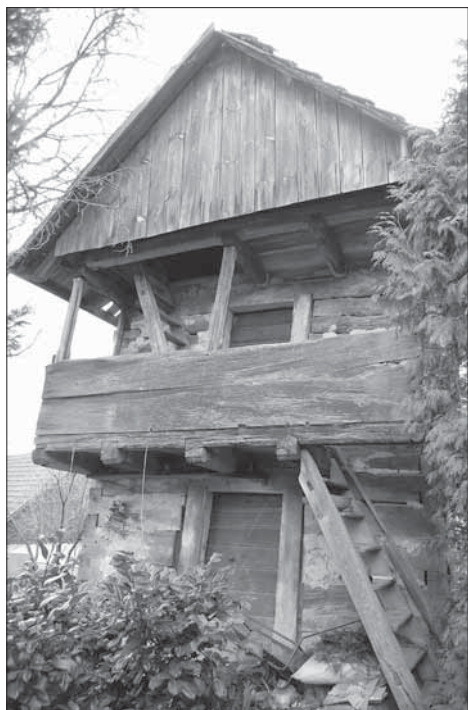
Lipová, robustní roubená patrová, památkově chráněná komora u usedlosti čp. 22.