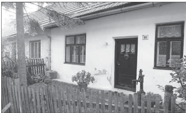
Sidonie, domek čp. 90 v dělnické kolonii.