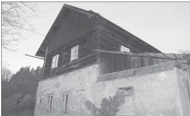
Sidonie, vodní mlýn čp. 104 s roubeným patrem.