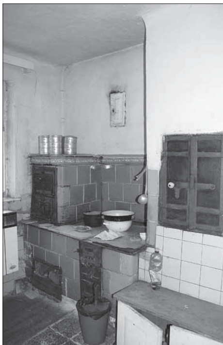
Šanov, kachlová kamna s troubou v kuchyni usedlosti čp. 53.

první z nich se vstupuje po dřevěném schodišti. Je to velký prostor s nábytkovým vybavením skříněmi. Přes něj se vchází do velmi dobře zachovalé a zařízené ložnice s dvoupostelí, stolkou, kostnem , pohovkou, železnými kamny a šicím strojem. Všudy přítomné jsou na stěnách svaté obrázky a kříže. Na dveřích a oknech se uplatňuje kvalitní zdobné kování. Na obytnou část navazovaly původně chlévy, majitelem později upravené na zázemí pro vaření povídel se zděnými kamny a kotlem. V zadní části dvora zabírá na celou jeho šířku postavená stodola. Do značné míry se zachovalo i vybavení patrové komory s podsklepením. V předzahradce u komory se nachází pístová pumpa na vodu. Kvalitní nábytek, plno truhlic, ošacení, knih, časopisů apod. i hospodářské zařízení svědčí nejen o dobrém sociálním a společenském postavení majitele, ale i o jeho kulturně společenských zájmech a rozhledu. Podobné patrové usedlosti se kromě Šanova nacházejí i v obci Lipová (např. čp. 39, 65, 18, 79) či Rokytnici (čp. 16, 13 a další) i v nedalekých Vrběticích (např. čp. 27 aj.).