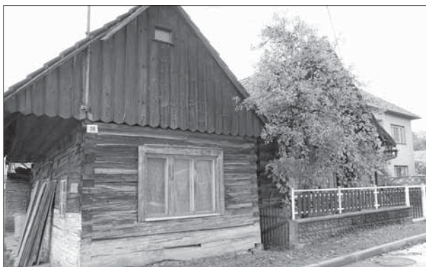
Nedašova Lhota, památkově chráněná usedlost čp. 38 ve velmi špatném stavebně technickém stavu.