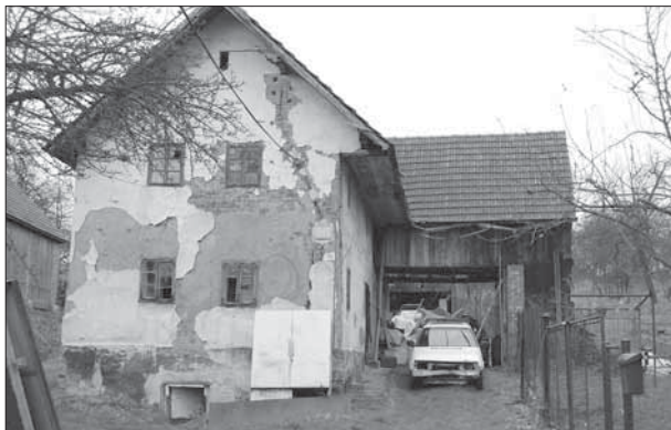
Lipová, patrová, památkově chráněná usedlost čp. 79.