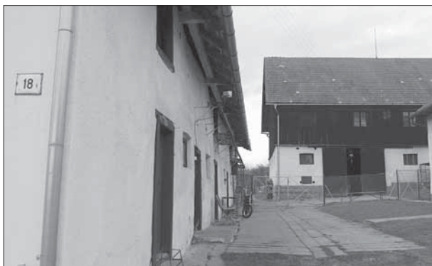
4. Lipová, miškářská usedlost čp. 18 postavená ve 20. letech 20. století podle německých vzorů.