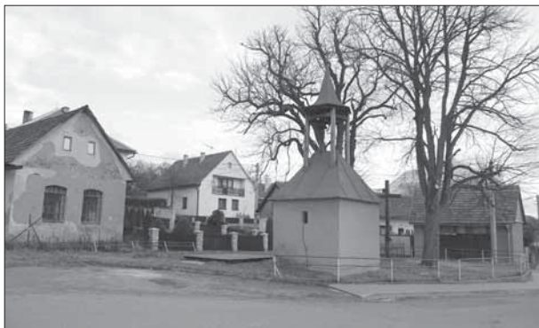
Lipová, náves se zvonící a křížem obklopeným lípami, v pozadí kovárna.