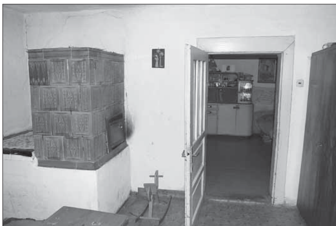
Popov, interiér světnice s kachlovými kamny a nízkou pecí v usedlosti čp. 69.

prvky. K modernizaci docházelo i u použitých výplní oken a dveří, kdy čtyřtabulková okna byla nahrazována okenními rámy ve tvaru písmene „T“ apod.