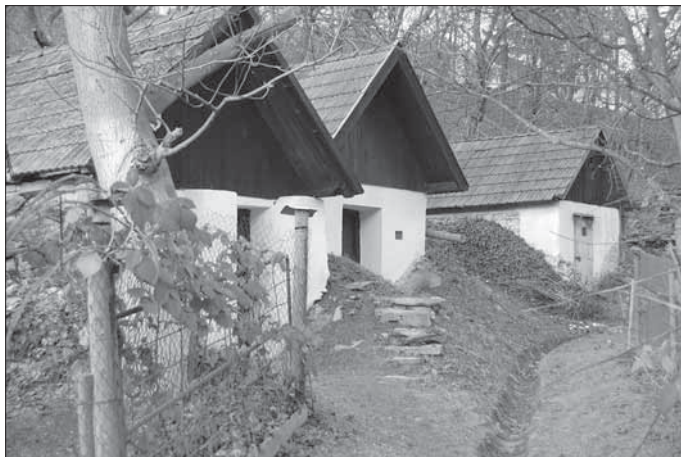
Sidonie, soubor chlévů za kolonií domů čp. 82–91.