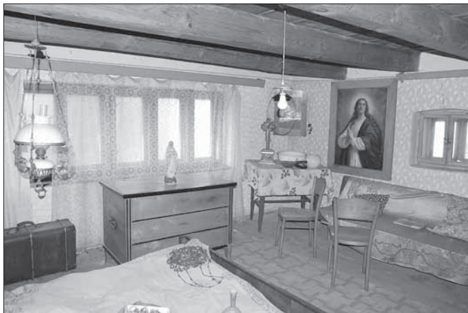
Šanov, plně zařízený interiér ložnice v patře usedlosti čp. 53.