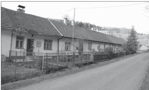
Sidonie, kolonie dělnických domů čp. 82–91.