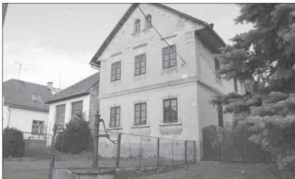
Lipová, patrová usedlost čp. 39.