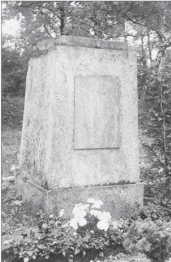
3. Zbytek legionářského pomníku na fotografii (patrně z roku 1983) z evidence památníků Svazu protifašistických bojovníků (SOKA UH, OV SPB, i. č. 37).

V březnu 1919 se moci v Maďarsku chopil radikálně levicový režim sovětského typu. Československo reagovalo mobilizací, vyhlášením stanného práva na Slovensku a jeho jednotky překročily demarkační linii. Záhy však maďarské jednotky nabyly nad méně zkušeným československým vojskem převahy a jejich protiofenziva vyústila až v obsazení značné části slovenského území. V době, kdy se v polovině června konečně posílené a reorganizované československé vojsko nadechovalo k vážnějšímu náporu, zasáhli diplomaté. Dohodové mocnosti si vynutily příměří, podle nějž měla maďarská vojska Slovensko do 5. července 1919 vyklidit. Neúspěšné vystoupení ozbrojených sil při obsazování Slovenska