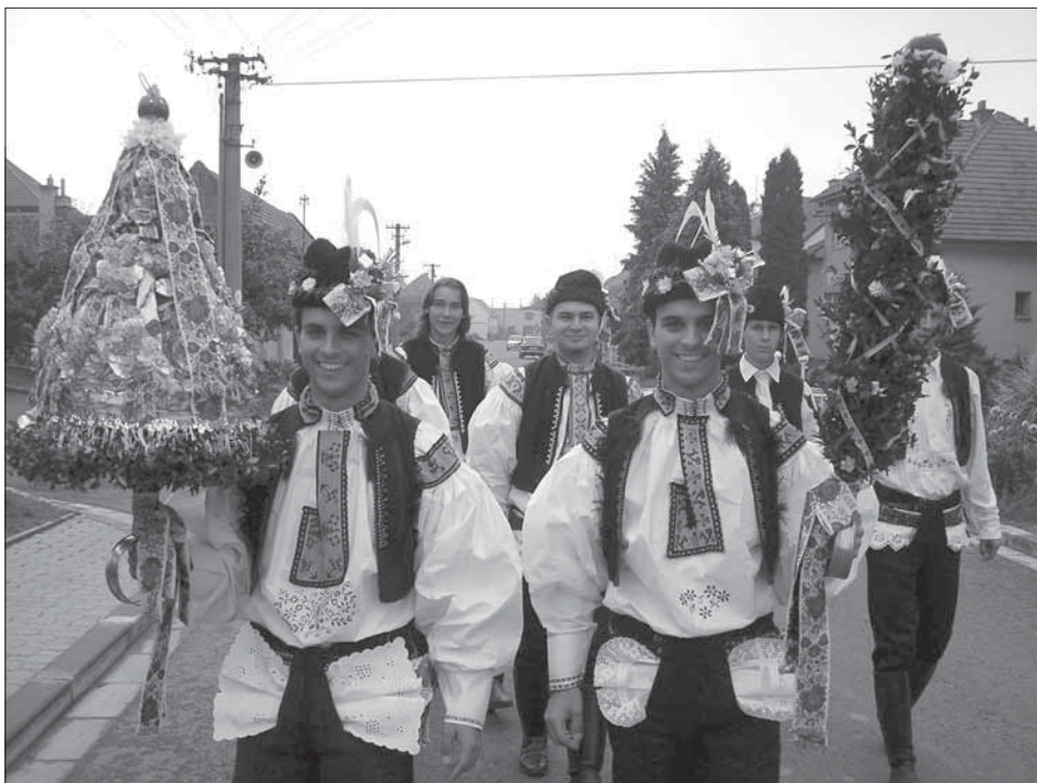
Stárci se svými právy. Traplice 2004.

pod malým stanem. Po mši se jde nejprve k mladšímu stárkovi, následně k mladší stárce, pak ke staršímu stárkovi a ke starší stárce. V čele průvodu při obchůzce obce jde chlapec – podstárek s malým květináčem rozmarýnu, na kterém jsou navázané barevné mašličky. Starší stárek má právo jehlancovitého tvaru, při spodním okraji ozdobené zelení, po ploše celé s umělých kvítků a pozlátek, na špici s jablkem. Od špice práva visí slovácké stuhu. Podprávem je šavle upravená do štíhlého válce z krušpánku, ozdobeného drobnými kvítky a do kosočtverců převázané stuhami. Znakem stárek jsou různé zdobené dorty. Po povolení hodů na obecním úřadu se jdou tito obřadníci i se starostou poklonit k sošce Panny Marie, stojící uprostřed dědiny, kde položí kytici květin. Po tomto aktu donese starosta stárkám znovu dorty a chasa jde do sokolovny na taneční zábavu. V neděli stárci se svými stárkami a právy v rukách obcházejí celou obec. Na svátek sv. Kateřiny se konají babské hody s právem – taneční zábava, kdy ženy jsou oblečené v mužských krojích a muži zase za ženy.