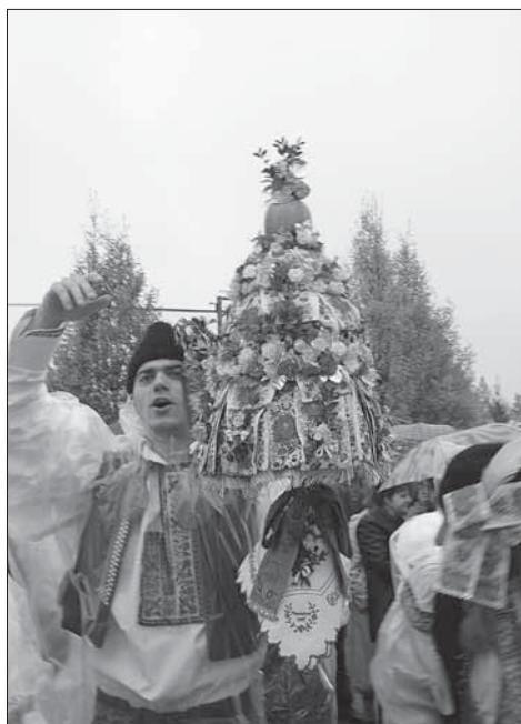
Starší stárek s právem. Mařatice 2007.

Příměstská část Mařatice pořádá Tradiční hody s právem třetí neděli v říjnu – hody císařské. Chasa se schází před areálem Mesitu, odkud se vychází pro stárky. Hlavními aktéry jsou starší stárek a stárka; v posledních letech se nepodařilo zvolit mladší stárky, i když mnohdy jde i přes třicet párů mladých lidí. Hodovou obchůzku povoluje obvykle místostarosta u kulturního zařízení. Právo nesené na meči má tvar jehlanu. Je zhotovené z přeložených slováckých stuh, plocha je posetá barevnými kvítky, snítky krušpánku, nahoře s jablkem. U rukojeti je bílý kapesníček červeně vyšitý a červené stuhy. Malým právem je šavle obalená krušpánkem a posetá pestrými kvítky, u rukojeti navázaná slovácká stuha a na špici zapíchnuté jablko. V roce 2006 šel v čele průvodu podstárek s rozmarýnem v květináči