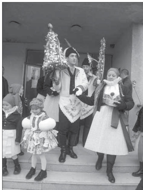
Starší stárek s právem, mladší stárek s podprávem, starší stárka s pokladničkou v rukách. Buchlovice 2005.

V Buchlovicích se každoročně druhou sobotu v listopadu konají Martinské hody s velkým počtem účastníků. Obchůzka začíná v sobotu ráno. Stárci i chasa se scházejí v centru obce. Odtud jdou na obecní úřad pro povolení hodů a pak obcházejí obec s přesným plánem trasy. Děvčata včetně stárek mají kacabajku zdobenou snítkou myrty s bílou stužkou, popř. ve výstřihu kacabajky zasunutý muškát nebo růži. Chlapci mají snítku s malou bílou stužkou na klopách lajblů. Starší stárek nese právo v podobě jehlanu na šavli; povrch je bohatě zdobený navázanými barevnými mašličkami, kvítečky, zelení s vlající trikolórou. Mladší stárek nese podprávo, kterým je úzká šavle zdobená různobarevnými umělými kvítky, asparágem, na špičce jablkem a vlající trikolórou. Znakem staršího a mladšího stárka je větší bílý plátěný šáteček, upevněný v pase. Ten je posít drobnými kolečky a snítky rozmarýnu nebo myrty s malými bílými stužkami. Stárky nesou v ruce malované dřevěné pokladničky. Celodenní obchůzka končí hodovou zábavou. V neděli ráno je hodová mše a chasa pokračuje v obchůzce obce.