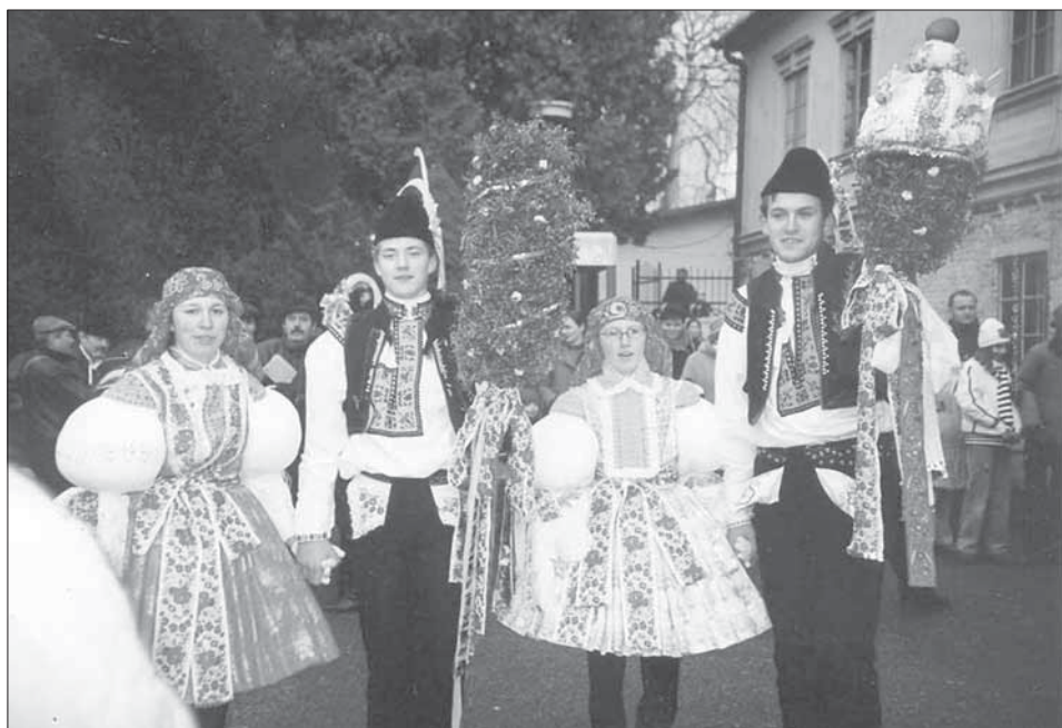
Velké a malé právo v rukou chlapců. Bílovice 2004.

V obci se dnes slaví hody kateřinské poslední listopadovou sobotou, kdy začíná slavnost žehnáním práv v kostele sv. Jana Křtitele. Pak jde hodový průvod od mladšího stárka k mladší stárce a od staršího stárka ke starší stárce a nakonec se prosí o povolení hodů. V čele průvodu