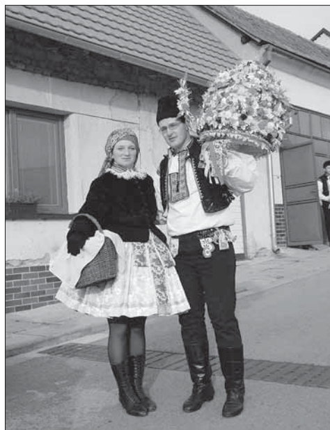
Starší stárka s košem a stárek s právem, druhý hodový den. Boršice 2007.