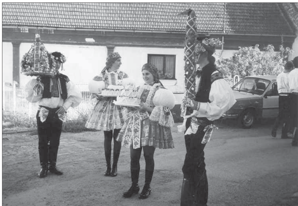
Stárci s právy, stárky s dorty. Jalubí 2004.

V obci se hody původně konaly třetí neděli v říjnu tzv. císařské hody , kdy byly v režii spolků. Od roku 2002, při příležitosti svěcení praporu a znaku obce, se začaly pořádat hody, které se dnes slaví zároveň s poutí o svátku Nanebevzetí P. Marie, okolo 15. srpna. Hlavními protagonisty jsou starší a mladší stárek a stárka a také podstárek. Ten cifruje v čele průvodu,