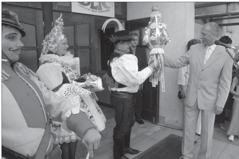
Starosta předává právo staršímu stárkovi. Ostrožská Nová Ves 2005.