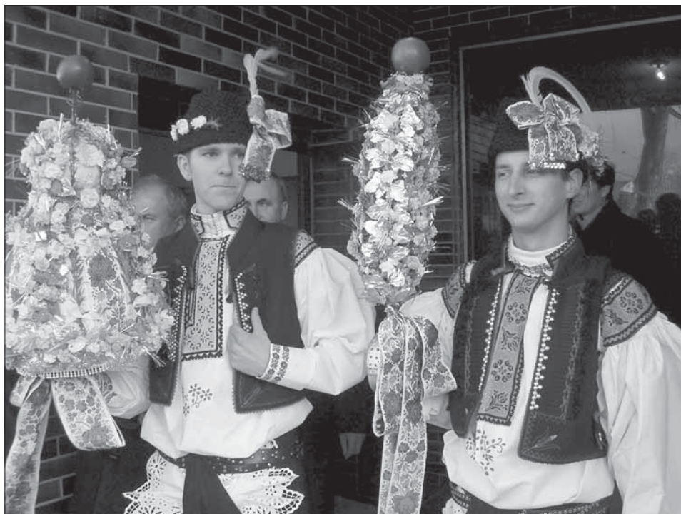
Stárci se svými právy. Huštěnovice 2004.

V obci se slaví Kateřinské hody s právem poslední listopadovou sobotu. I když od roku 1958 se konaly v neděli a v pondělí, s hodovými dozvuky ve středu, od roku 1979 byla hlavním hodovým dnem sobota. Od roku 1986 se hodového průvodu zúčastňovala i děvčata; bylo pravidlem, že v průvodu chodili jen muži, chlapci a dvě stárky. Hlavním atributem staršího stárka je právo na šavli, které má podobu jehlanu, s bohatou výzdobou drobných kvítek, stříbrných pozlátek a stužek; od rukojetě pak visí několik širokých slováckých stuh. Právo je ukončené červeným jablkem. Až starosta vydá písemné povolení konat hody, stárek si jej připevní na právo. Mladší stárek má právo na kratší šavli, oválného tvaru, bohatě zdobené barevnými umělými kvítky, stříbrnými lístky a zelení, na špici s jablkem. Několik širokých stuh visí od rukojeti. Každá stárka nese dort, každoročně jinak cukrářsky