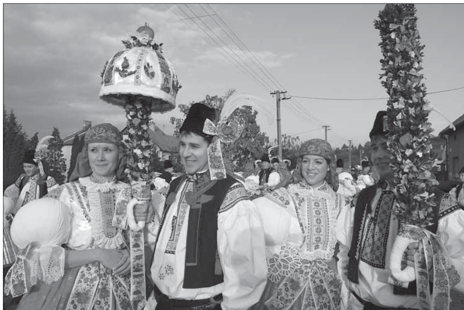
Stárce a stárky se svými právy. Jarošov 2007.

Tak jako v okolních obcích i v Jarošově se slaví císařské hody, i když mají kapli zasvěcenou P. Marii Růžencové a mohly by se slavit hody první říjnový víkend. Slovácké hody s právem začínají v sobotu odpoledne mší svatou za hodovou chasu se svěcením práva v místní kapli.