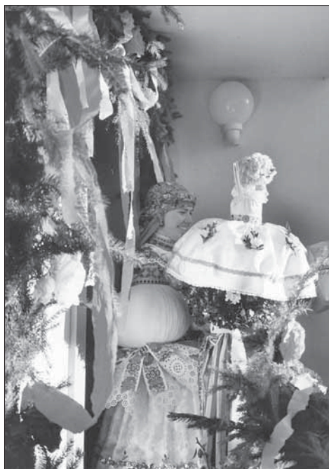
Starší stárka s právem v podobě panenky v ozdoběném vchodě domu. Nedachlebice 2003.