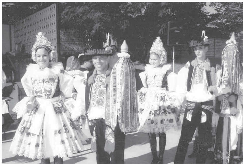
Stárci a stárky se svými právy. Ostrožská Lhota 2003.

Největší slavností v Ostrožské Lhotě jsou patronské hody s právem, které se konají pravidelně každý lichý rok. V obci se pořádají hody v neděli blíže k svátku sv. Jakuba Většího (25. července). Jakubské hody, které se slavily ještě dříve než ustanovil Josef II. hody