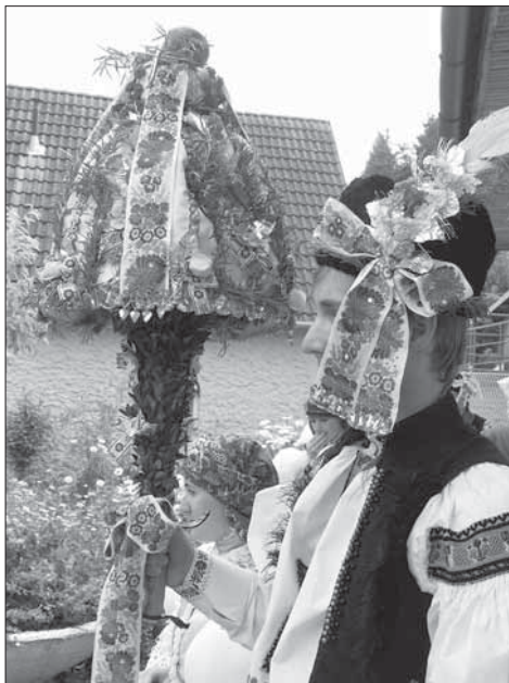
Stárek s větším právem. Jankovice 2005.

s květináčem rozmarýnu v ruce. Znakem stárků je větší a menší právo. Větší je nesené na šavli, má baňatější tvar po obvodu s krajkou, po ploše zdobené barevnými kvítky a zelení, na špici jablko. Vespod je vyplněné krušpánkem, který zdobí i část šavle. Menší právo je ve tvaru širšího válce z krušpánku, s drobnými umělými kvítky, omotaný zkrříženou slováckou stuhou. Atributem starší stárky býval upečený beránek a mladší stárky dort; v roce 2003 nesly obě stárky dorty. Znakem stárků jsou také ozdobené beranice myrtovým věnečkem s bílými květy. V hodovém průvodě táhnou ženatí muži vozík ozdobený chvojím naplněný pitím. Obchůzka s právy v neděli pokračuje. Všichni jsou oblečeni v slavnostním kroji, jen děvčatům chybí úvaz tureckého šátku. Zato mají v rukou pokladničky.