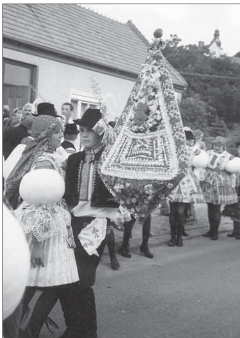
Stárek s právem v podobě štítu. Ořechov 2004.

členové oblečení v uniformách zajišťují bezpečnost chasy i návštěvníků hodové obchůzky. Zvláštností ořechovských hodů je osm hodových funkcionářů – starší stárek a stárka, mladší stárka a stárek a oba tyto páry mají pomocníky – mladšího a staršího podstárka a podstárku. Znakem ořechovských hodů jsou dvě stejná práva, která jsou na šavli a mají tvar kosočtverce. Střední trojúhelníkovou část tvoří naskládaná bílá stužka, uvnitř jsou v několika řadách nad sebou naskládané barevné stužky do trojúhelníků. V horním cípu je věneček z drobných umělých květů a okraje práva lemuje slovácká stuha. Výzdobu doplňují různobarevná umělá kvítka a zeleň ve spodní špičaté části práva. Na špici je u obou práv zapichnuté jablko. Po vyzvednutí mladších a starších stárků a stárek si chodí chasa pro povolení hodů; v roce 2004 je starosta obce vydal na tanečním kole. V neděli po hodové mši svatě pokračuje hodová obchůzka s ukázkou hodového práva . Původně konané hody na Kateřinu se pro pozdní termín neosvědčily, takže v tento čas se v současnosti konají dozvuky hodů.