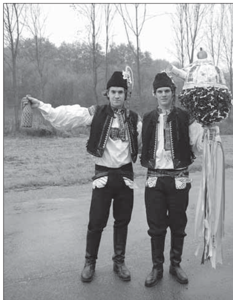
Chlapec drží v ruce velké právo i s povolením hodů. Svárov 2007.

pro mladšího a pak pro staršího stárka, stejně je to i se stárkami. Hlavními insigniemi stárků jsou práva. Obě práva mají stejný tvar v podobě zvonu; jedno je zhotovené z bílé, druhé ze žluté látky, nejspíš brokátu, nesené na meči. Při spodním okraji je našitá zlatá porta s řadou přívěsků a po ploše jsou našité umělé kvítky, mašličky a při spodním okraji řada zrcadélek. Nechybí ani větvičky z rozmarýnu a od naskládaného křezlu z krajky, kde je nabodnuté jablko, volně visí slovácké stuhy. Stárci mají na klopě dlouhou větvičku z myrty s bílou mašličkou. Pro povolení chodí stárci s chasou na obecní úřad. Obchůzka s právy pokračuje i druhý hodový den.