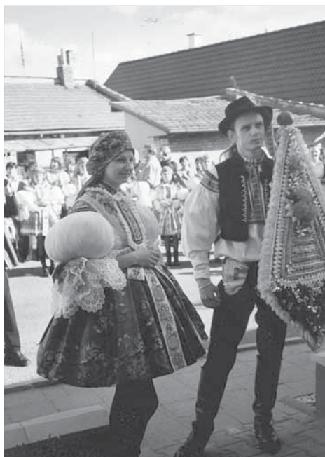
17. Mladší stárek a stárka s malým právem. Medlovice 2007.

s navázanými červenými stužkami. V neděli chasa i s právy obchází Mařatice; stárky dostávají do nesených malovaných dřevěných pokladniček peníze.