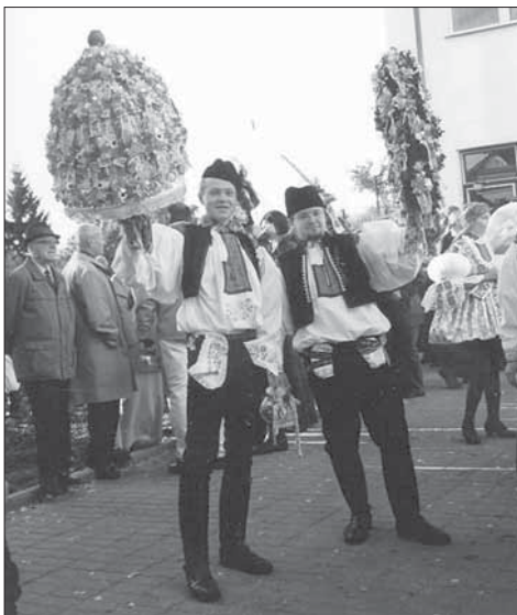
Stárci se svými právy. Zlechov 2003.