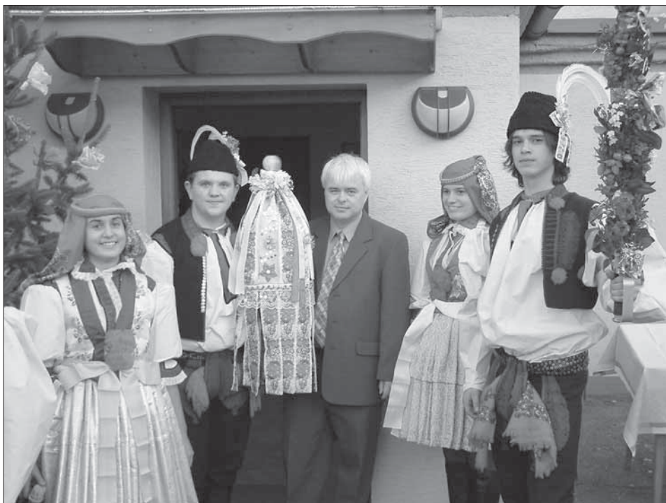
Starosta obce povolil stárkům hody. Podolí 2003.

císařské, byly slavnější. V neděli před hody chodí chasa k loňským stárkům pro hodová práva, aby je stárky nazdobily. V sobotu obchází chasa oblečená v polosvátečním kroji obec a zve na hody. Povolení k hodům vydává starosta, který před obecním úřadem přečte listinu s právy a povinnostmi hodové chasy a stárků. Pergamen pak vloží do velkého práva. Velké i malé právo mají tvar dřevěného válce se soustruženým hruškovitým koncem, odkud visí mnoho barevných stuh. Po uhoštění starostou odchází hodová chasa na taneční zábavu. I v Ostrožské Lhotě, stejně jako jinde na Ostrožsku, chodí starší i mladší stárka o hodech v obřadním pentlení, které nosí nevěsty a družičky o svatbě.