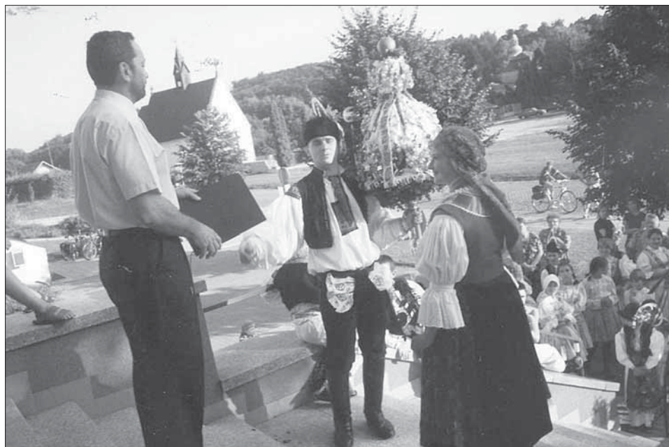
Stárek a stárka s právem při povolování hodů na obecním úřadě. Velehrad 2005.