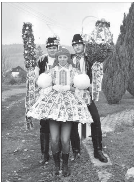
Stárci se svými právy. Kudlovice 2003.

posetý drobnými barevnými kvítečky a šikmo ovázaný slováckou stuhou; nahoře je zapíchnuté jablko. Ženatí muži vozí v hodovém průvodu bečičku s vínem. Na druhý hodový den obchůzka i s právy pokračuje. Nevynechají ani vzdálenou Kudlovickou dolinu.