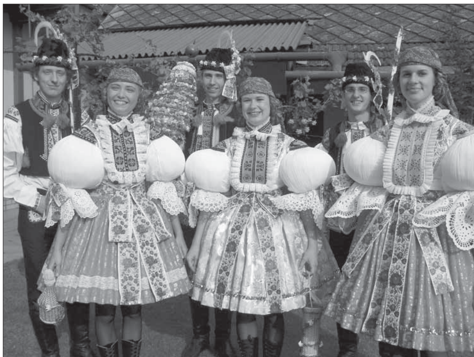
Dva mladší stárce a stárky a starší stárek a stárka se svými právy. Staré Město 2005.

Patronské hody na svátek sv. Michala se slaví ve Starém Městě vždy nejbližší datu 29. září. Hody nesly název michalské dnes Michalské slavnosti – Hody s právem , neboť jsou spojené s dalšími folklorními aktivitami na druhý hodový den. Neobvyklý je počet stárků; staršího stárka a stárku doprovází dva mladší stárce a dvě mladší stárky. Hody začínají v pátek zapalováním hodů – zdobením vchodů rodných domů stárků upletenými věnci. Hlavním hodovým dnem je sobota, kdy mladší stárce jdou pro staršího stárka a pak s chasou jdou do domu stárky. Tam dostávají hodové atributy – dvě malé a jedno velké právo, beranice, po obvodu ozdobené zelení a bílými kvítky a paličky ovázané bílou stuhou a asparágem. Pak chasa odchází pro povolení na radnici a následuje občůzka po obci. Velké právo má tvar kužele, jehož základ je ze slováckých stuh a zdobení je v hustých řadách barevnými umělými kvítečky, zrcadélky, stříbrnými třásněmi a myrtou. Na špici je nařasená krajka a zapíchnuté červené jablko. Dvě malá práva jsou jemně ozdobená bílou stuhou a omotané asparágem. Večer je hodová zábava za účasti stárků a rodičů stárků. V neděli je hodová mše svatá a po ní pokračuje občůzka stárků s právy a celou chasou po městě.