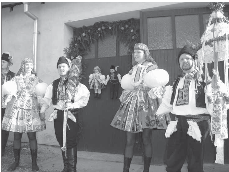
Stárci se velkým a malým právem před vyzdobeným domem. Topolná 2004.

Po mnoha změnách termínu se v současnosti slaví Svatováclavské hody . V obci je zvyk, že symbol stárkovské moci – práva musí současní stárci vykoupit od stárků z předešlého roku. Vykupování se zúčastňuje celá chasa. Potom se staré právo odnese do domu stárek, kde se obnoví a připraví na slavnost. Hody začínají v sobotu svěcením práv v kostele a pokračují obcházením stárek a stárků a povolením hodové veselice. Právem je krátká bílá panenka na hůlce, ozdobena po obvodu spodního okraje krajkou a krušpánkem. Tím je zdoben i vrch práva, kde je posazené jablko; odsud visí barevné stuhy s věnečky, které přecházejí přes délku sukýnky. Malé právo má tvar kužele z husté zeleně, převázané po ploše stuhami do kosočtverců, nahoře s jablkem. V neděli začínají hody mší svatou a pak chasa obchází obec s beranem na ozdobeném vozíku i s hodovými s právy. V roce 2004 uspořádala obec Setkání topolských stárků .