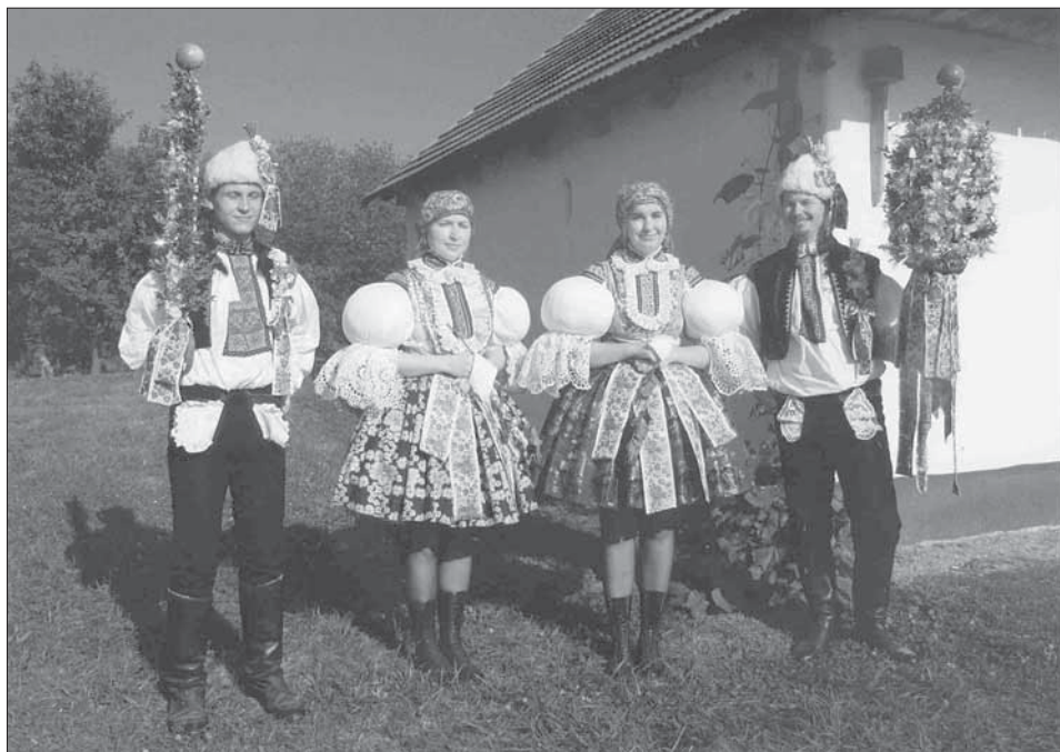
Stárky v bílých beranicích s právy, stárky s růžemi v rukách. Kostelany 2006.

Jedny z posledních hodů v církevním roce, které se na uherskohradištském Dolňácku slaví, jsou Martinské hody s právem v Kudlovicích. Nejprve se jde pro chlapce stárky a potom pro děvčata–stárky. Atributem obou stárků jsou beranice po obvodu zdobené myrťou s bílými kvítky a větší a menší právo. Třetím funkcionářem je podstárek, který nese v čele průvodu květináč s krušpánkem, ozdobený drobnými červenými stužkami. Velké právo nesené na šavli má bílý brokátový podklad ve tvaru jehlanu, po obvodu zdobené krajkou. Právo je vespod bohatě vyplněné krušpánkem. Barevnou výzdobu umělých květů, navázaných mašliček a slováckých stuh, oddělují zelené snítky myrty. Bohatý věneček z květů a zeleně zdobí špici práva spolu s jablkem. Malé právo je štíhlý zelený válec z krušpánku,