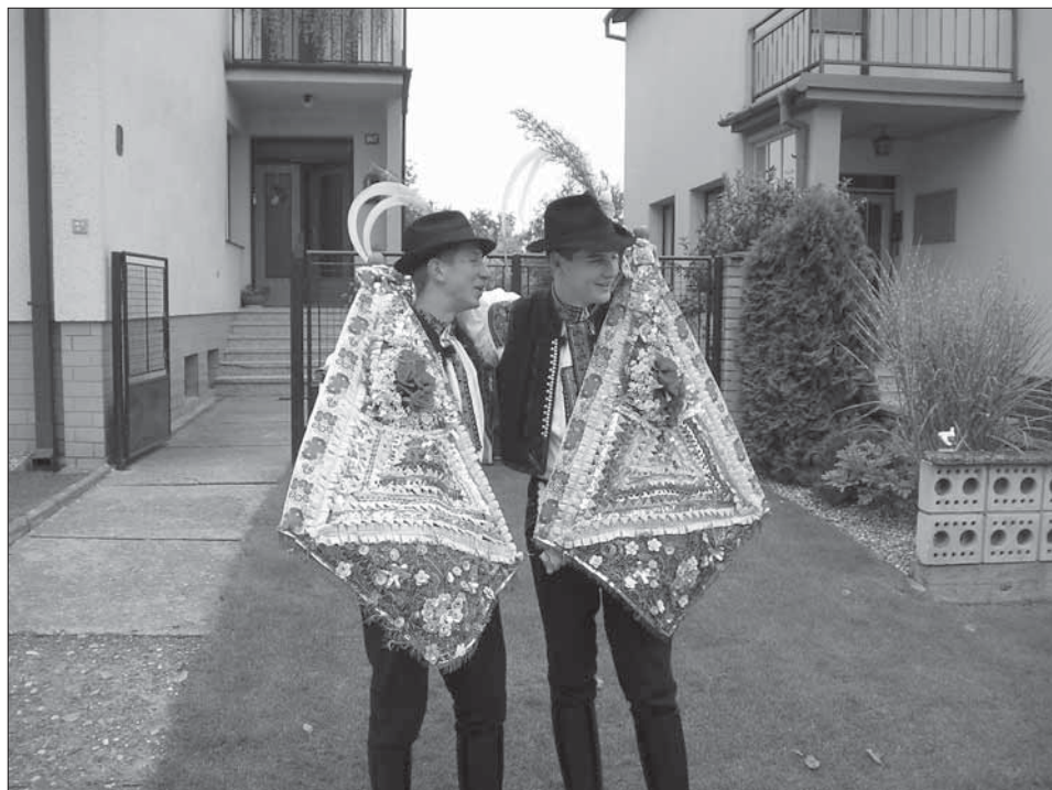
Stárci se svými právy. Polešovice 2004.