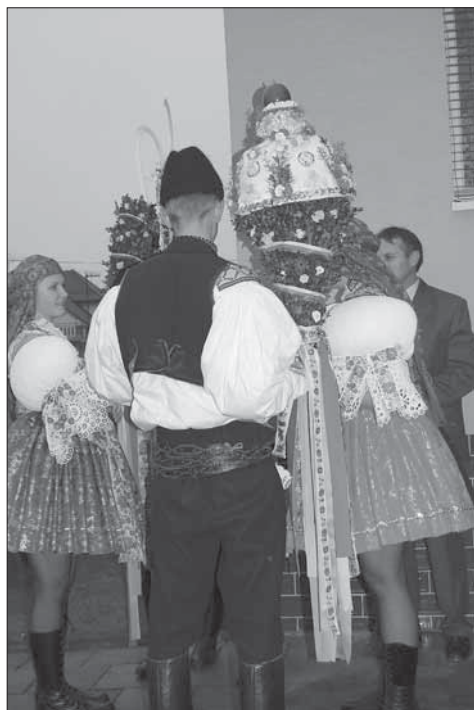
Stárce před domem stárky se svými právy. Kněžpole 2007.

Kněžpole je obcí, kde se slaví hody čtvrtou nedělí v říjnu, tzv. hody republikánské okolo data vzniku Československé republiky. Současné Slovácké hody s právem začínají v sobotu odpoledne, kdy se svítí práva v kapli sv. Anny, a pokud jsou v obci zvoleni stárce, jde se pro mladší a starší stárky. Hodový průvod v čele se stárky jde pro povolení na obec. Starší stárek nese právo ve tvaru krátké panenky se sporou výzdobou barevných umělých kvítků a krušpánku, nahoře s červeným jablkem. Zbytek šavle až po rukojeť je ověšený krušpánkem s drobnými barevnými kvítečky s omotanou trikolórou, od rukojeti volně spadají široké stuhy. Malé právo má tvar májky z hustého krušpánku posetého drobnými barevnými kvítky a je vertikálně omotané úzkou trikolórou. Od rukojeti visí řada širokých stuh. Večer na taneční zábavě tančí kněžpolská chasa Moravskou besedu . V neděli pokračují hody obchůzkou krojovaných, kteří vozí berana po obci. Za dva týdny po hodech se konají babské hody s právem , kdy ženy jsou převlečené za muže a muži za ženy a v doprovodu harmonikáře obcházejí obec. Obchůzka končí taneční zábavou.