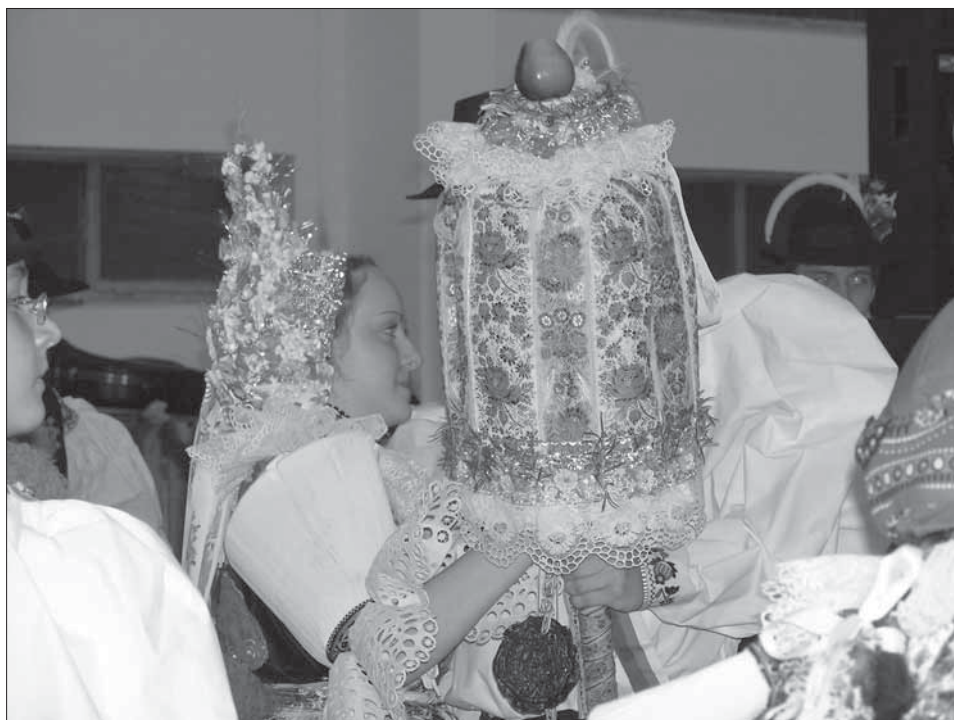
Stárka s velkým právem na večerní taneční zábavě. Uherský Ostroh 2004.

Ostrožské hody s právem – hody císařské nebo tzv. tereziánské se v Uherském Ostrohu slaví třetí neděli v říjnu. V pátek odpoledne před zámek chlapi postaví hodový māj a koná se beseda u cimbálu. V sobotu je chození po stárkách ; průvod vedou děvčata s klobouky se stárkovskými vonicemi, za nimi děti, dospělí a nakonec muzika. Průvod směřuje k domu mladšího stárka, kde mu děvče předá klobouk a zatančí sólo. Hodový průvod jde k mladší stárce, kde ji žádá mladší stárek o právo. Je to šavle omotaná slováckou stuhou a rozmarýnem, na špici má zelené jablko. Mladší stárka od něj dostane džbán vína. Od staršího stárka se jde ke starší stárce, která dá stárkovi právo v podobě delší panenky ze svisle našitých slováckých stuh, okolo okraje s krajkou, na špici s červeným jablkem, s límcem z krajky a umělých kvítků. Stárka od něj na oplátku dostává talíř s ovocem. Na městském úřadu starosta povolí hodovou slavnost. V neděli se koná hodová mše. Zvláštním znakem pro obě stárky je, že chodí první hodový den oblečené po bílu, stejně jako družičky či nevěsty s čepením na hlavě.