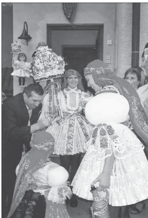
Stárka předává právo stárkovi. Sady 2007.

zeleným asparágem, s většími umělými kvítky, ozdobami z barevného staniolu a na špici s jablkem. Starší stárka nosí v ruce ošátku s ovocem, mladší džbáněk s vínem. Na druhý hodový den se v Popovicích vozí beran na vozičku ozdobeném jehličím a papírovými růžemi; v současnosti se stává, že se vozí i ovečka. Dozvuky v podobě recesních babských hodů se konají za týden.