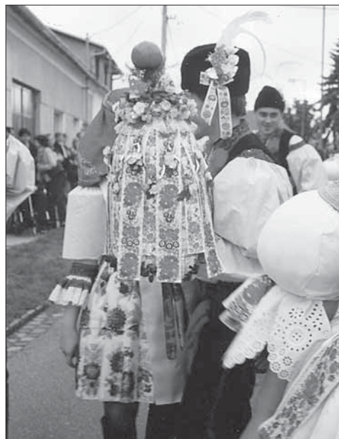
Velké právo v rukou tanečnicků. Véscky 2007.