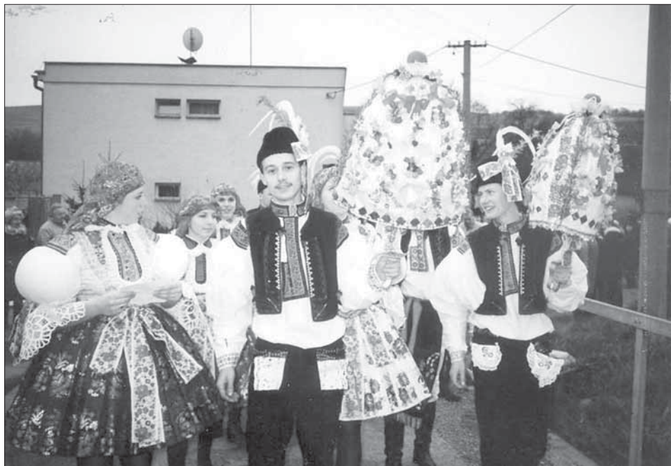
Stárci se svými právy. Stříbrnice 1995. Fotoarchiv SM.

V obci se naposledy konaly hody v roce 1995 na svátek sv. Martina, druhou sobotu v listopadu (obec dlouho patřila do buchlovické farnosti, kde je kostel zasvěcen sv. Martinu). Funkcionáři jsou starší stárek a stárka a náhradníci (mladší stárek a stárka). Nejprve se jde