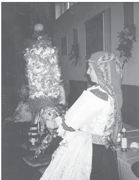
Děvče s větším právem. Míkovice 2003.