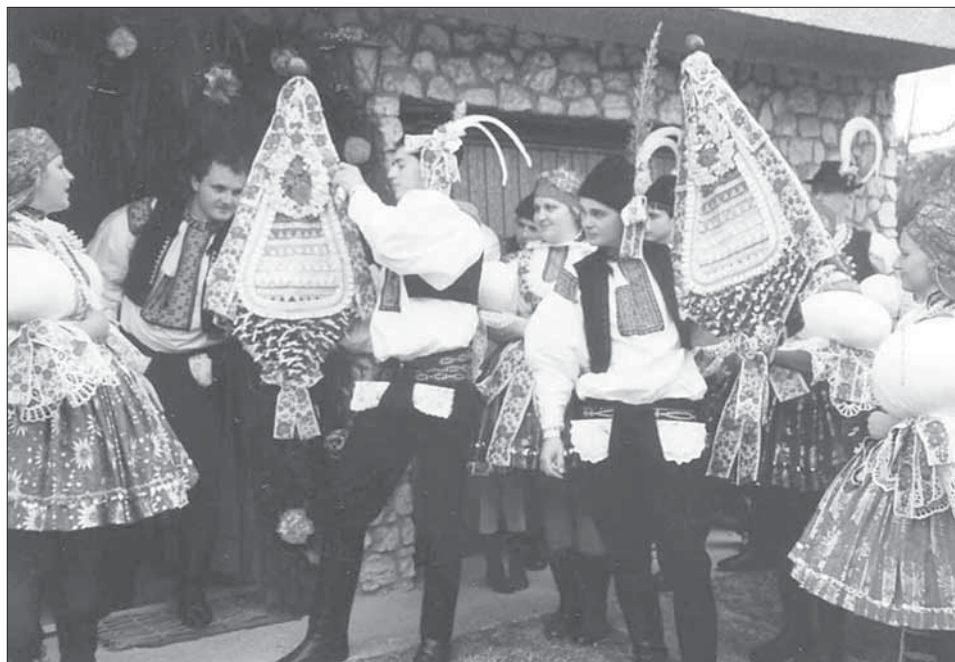
Stárci a stárky se svými právy. Tučapy 2004.

stranách slovácké stuhy. V neděli se koná hodová mše.