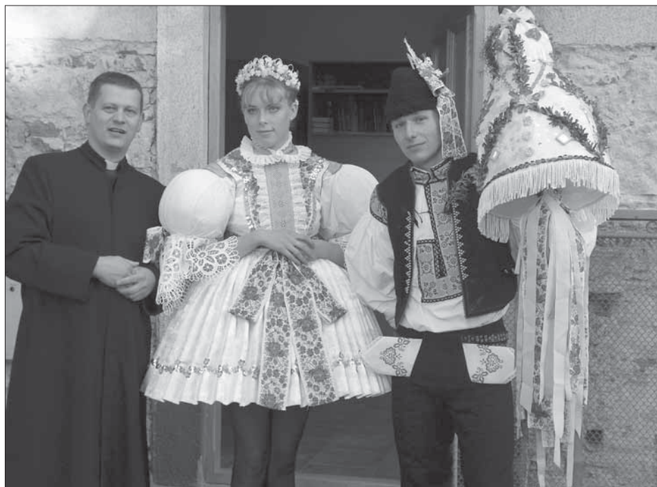
Stárka po bílu, ve věnečku, stárek s velkým právem. Březolupy 2005.

Slovácké hody s právem nebo také Březolupské hody se nazývají hodové slavnosti, které se slaví třetí, někdy druhou sobotu v říjnu. Krojovaná chasa včetně školních dětí se schází před halou. V posledních letech chodí jen starší stárek a stárka. V Březolupech se nosí právo