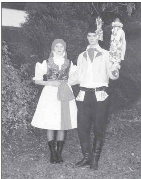
Mladší stárka a stárek se svým právem. Břestek 1998.

Malá obec Břestek patří k farnosti Buchlovice, kde se slaví Martinské hody s právem . Pořadatelem je některá z místních společenských složek a mládež. Tradiční obchůzka obřadníků začíná u mladšího stárka a stárky a pak se jde ke staršímu stárkovi a stárce. Atributem staršího stárka je právo v podobě panenky se sukničkami z brokátu, s rozmarýnem, na krátké šavli. Právo pro mladšího stárka je už jednodušší. Mečík se jen celý ozdobí rozmarýnem, opentlený se stuhami, přikrášlený umělými kvítečky a nahoře nabodené jablko. Po povolení hodů a průvodu po obci se koná hodová zábava. Chlapci mívají na beranicích velký rozmarýn s voničkou. Podle záznamů se podobně jako v jiných obcích, ještě v letech 1880 na druhý den, vozil a stínal beran.