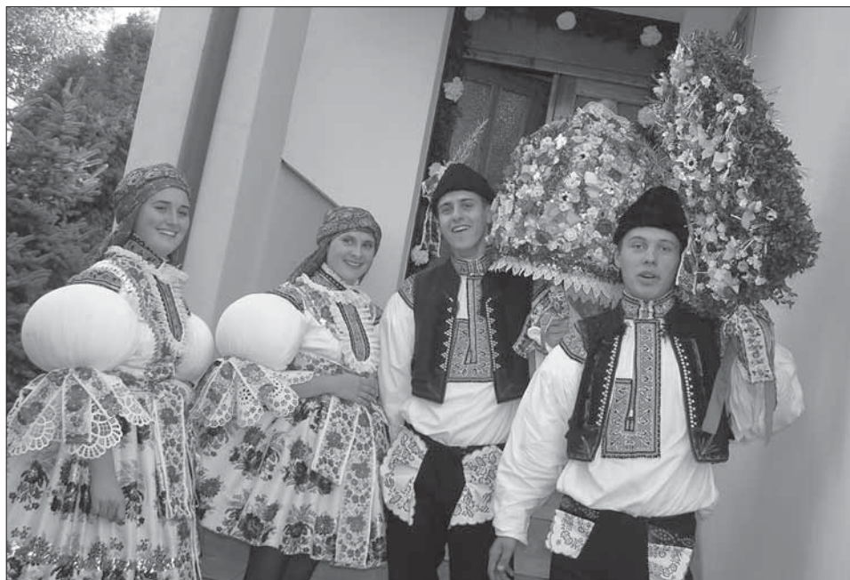
Stárci se svými právy. Boršice 2005.

Obec a boršická chasa slaví Slovácké hody s právem vždy třetí neděli v říjnu, tedy hody císařské , i když je zde kostel zasvěcený sv. Václavu a mohli by oslavovat václavské hody poslední zářijový víkend. Starší stárka a stárek, mladší stárka a stárek si chodí s chasou pro povolení před obecní úřad. Znakem starších stárků je právo na šavli, v podobě větší koule, při spodním okraji olemované zoubkovanou krajkou, plné umělých barevných květek, snítek krušpánku a rozmarýnu, ukončené jablkem. Malé právo se odlišuje od všech z okolních obcí. Má tvar velkého plochého trojúhelníku, neseného na šavli, po ploše a hlavně po obvodu je z hustě vázaného krušpánku a zcela pokryté umělými kvítky, mašličkami, na špici s jablkem. Chlapci mají na beranicích dlouhou snítku myrty. V sobotu v podvečer se chasa zúčastňuje hodové mše svaté konané v místním kostele a večerní taneční zábavy. V neděli pokračuje obchůzka krojovaných po obci. Stárci s právy a stárky v kacabajkách s velkými koši, překrytými plátnem pokrývkou, chodí v doprovodu dechové hudby po obci a vybírají peníze. Mnohdy chlapci vozí na ozdobeném vozíku i pití.