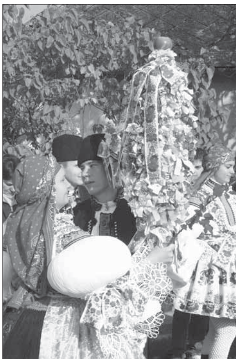
Mladší stárek s menším právem. Tupesy 2005.

Jako v řadě obcí i v Tupesích se slaví třetí neděle v říjnu císařské hody . Hodovými dny jsou v posledních desetiletích sobota a neděle. Večer před hody jde celá chasa společně pro právo k paní Malíkové, která právo upraví a nazdobí a odnesou je k mladší a starší stárce. Mládež se sejde na návsi. Obchůzka pak začíná u mladšího stárka, pak se jde pro mladší stárku, ke staršímu stárkovi a ke starší stárce. V domě mladší stárky čekají všechna děvčata. Starší právo má tvar zvonu, nesené na velké šavli. Kovová kostra práva je potažená brokátem a zdobena voničkami, rozmarýnem a pentlemi. Mladší právo tvoří šavle v podobě válce z krušpánku, hustě zdobená drobnými umělými kvítky, mašličkami v různých barvách. Na obou právech jsou na špici jablka. Na druhý den se obchází zase celá obec a večer je taneční zábava. Děvčata mají oblečené bílé pletené punčochy s plastickým vzorem a v ruce nesou jednu delší růži, dříve dorty.