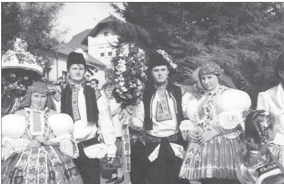
Stárci a stárky se svými právy. Mistřice 2005.

Obec Mistřice si referendem zvolila datum Slováckých hodů s právem druhou sobotu v říjnu. Hody začínají v kapli Nejsvětější Trojice, kde bývá malá pobožnost a kněz žehná práva. Tam chasa i starosta obce dá povolení k občůzce. Nejprve se jde pro stárky, pak se