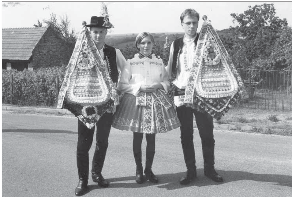
Stárci s právy na druhý hodový den. Vážany 2004.

Slovácké hody s právem , konané třetí sobotu v září začínají průvodem chasy, od malých dětí přes muzikanty a chasu, až po dva stárky, kteří jdou v závěru průvodu, před ženáci a vdanými ženami. V roce 2004 si šli stárci pro práva i nazdobené klobouky do jednoho ozdobeného domu obou stárek. Mladší i starší stárka předávala svým stárkům nazdobené klobouky a práva. Mají trojúhelníkový tvar, upevněné na meči, vytvořené z barevné podkladové látky. Vnitřní trojúhelník tvoří v řadách naskládané oranžové, modré či bílé stuchy do trojúhelníčků, v horní části práva je věneček z umělých kvítků se středovou růží. Ve spodní části je plocha hustě vyplněná zelení a barevnými kvítky, popř. větším květem. Po stranách visí slovácké stuchy a na špičce je posazené jablko. Od stárek jde průvod ke starostovi na obecní úřad pro povolení. Na druhý hodový den se koná mše svatá v kapli a odpoledne pokračují chasa i stárci s právy v ruce v obchůzce obce.