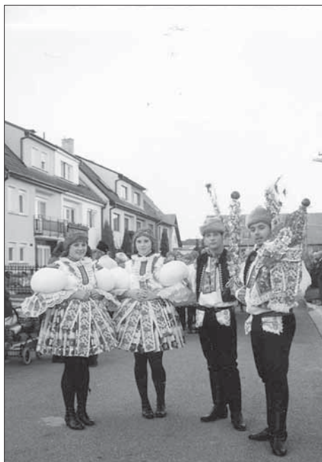
Stárci se stárkami a svými právy. Nedakonice 2003.

obchází obec. Právo, které nese starší stárek, má tvar krátké široké bílé panenky- sukýnky, při okraji zdobené zlatou portou. Horní konec práva je bohatě zdoben kyticí umělých kvítků, lístků a zapíchnutým červeným jablkem. Uvnitř je sukýnka hustě vyplněná krušpánkem; odsud také visí řada dlouhých barevných i slováckých stuh. Zvláštní tvar má menší právo; je jím svázaná větší kytice z krušpánku, až v podobě májky, s barevnými papírovými květy na koncích větviček. Není ukončené jablkem. Od spodní části visí plno barevných dlouhých stuh. V neděli je mše svatá v kapli a odpoledne hodová obchůzka po obci s malým právem. Děvčata oblečená v kacabajkách nesou kasičky.