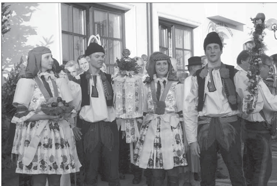
Stárci se svými právy, starší stárka s mísou ovoce. Kunovice 2005.

Město Kunovice dodnes udržuje tradice hodové obchůzky, která se koná čtvrtou sobotu v září – slaví se Svatováclavské hody s právem . Hody začínají v sobotu odpoledne hodovou mší. Z kostela jde průvod od mladšího stárka k mladší stárce a od staršího stárka ke starší stárce. Starší stárci nosí právo na hůlce v podobě delší panenky z jednobarevných i slováckých stuh, při okraji s našasenou krajkou, nahoře na kanýru z krajky, umělých květek a krušpánku je posazené jablko a pečeť města. Právo dostává i s ozdobenou beranicí od stárky. Mladší stárek nosí v ruce šavli ve tvaru úzkého válce ozdobenou krušpánkem, drobnými kvítky, stužkami a na špici s jablkem. Právo mu předá i s nazdobenou beranicí mladší stárka. Starší stárka nosí na talíři ovoce, mladší zase drží džbán s vínem. Na městském úřadě starosta