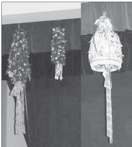
Velké i malé právo zavěšené v tanečním sále spolu s dětským právem. Zlámanec 2007.

Slovácké hody ve Zlámanci se konají čtvrtou neděli v říjnu, slaví se hody republikánské . Hodová občůzka začíná mši svatou v místní kapli. Obvyklí funkcionáři hodů letos nebyli zvoleni, proto starosta dal chas nejen povolení, ale také předal práva. Před obecním úřadem je zvykem postavit menší máj. Velké právo má tvar delší bílé panenky zhotovené z bílého brokátu, při spodním okraji s krajkou; plocha je rozdělena zlatou portou do dílů, které mají výzdobu navázaných mašliček, kvítek a snítek krušpánku. Na horní menší kulaté části je připevněné jablko. U rukojeti meče visí dlouhá navázaná slovácká stuha. Menší právo má tvar většího kuzele ze samé zeleně v podobě májku, zdobenou drobnými pestrobarevnými kvítky, navázanými barevnými stužkami a dlouhou stuhou u rukojeti. I zde chodí stárky oblečené jako nevěsty – po bílu ve věnečku. V roce 2007 měly ve Zlámanci své právo i děti. Tvarem a výzdobou bylo obdobou malého práva. Obchůzkou po obci v neděli končí hodová slavnost.