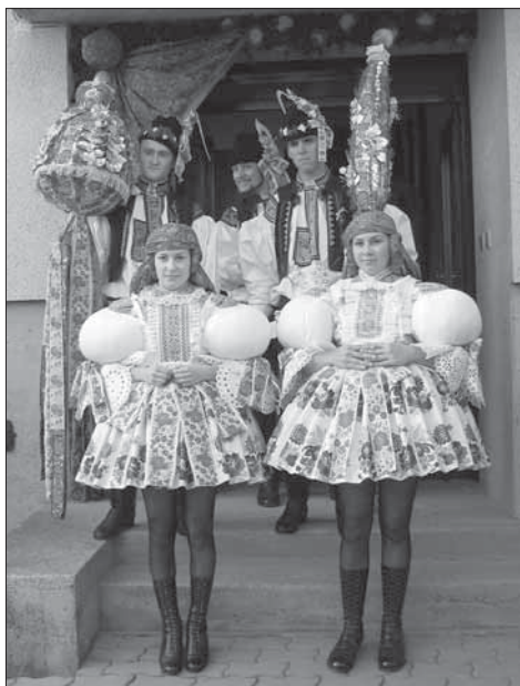
Starší a mladší stárek se svými stárkami a právy. Babice 2005.