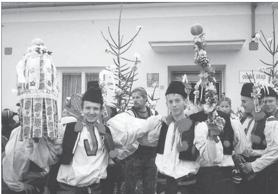
Stárci se svými právy. Popovice 2003.