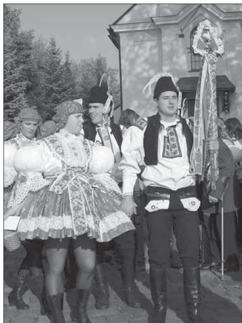
Chlapec s právem v podobě malého trojúhelníka. Částkov 2007.