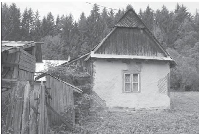
Ustedlost na čp. 79 – z roku 1953, dvouprostorová, roubená s diagonálně – klasovitě sestavených trámů, v kožichu. Žítková 2007.