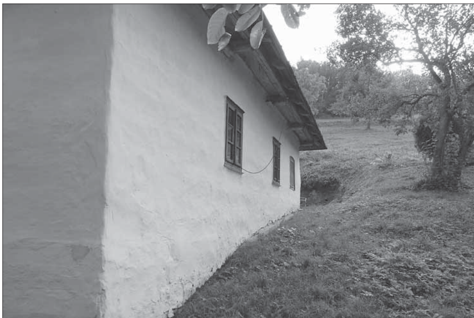
Usedlost čp. 68 – boční pohled na obytnou část, pod omítkou jsou znatelné jednotlivé vrstvy nabíjené hlíny. Ukázka zasazení stavby do svahu. Vápenice 2007.