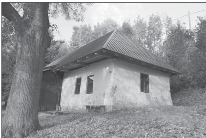
Usedlost čp. 28 – z nabíjanice . Příklad nevhodně opravené střechy. Vápenice 2007.