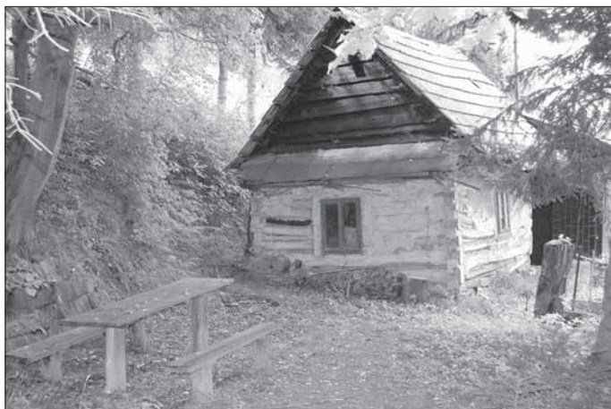
Ustedlost čp. 69 – torzo roubeného objektu, štít sestavený s horizontálně kladených nehraněných desek. Žítková – Koprvasy 2007.