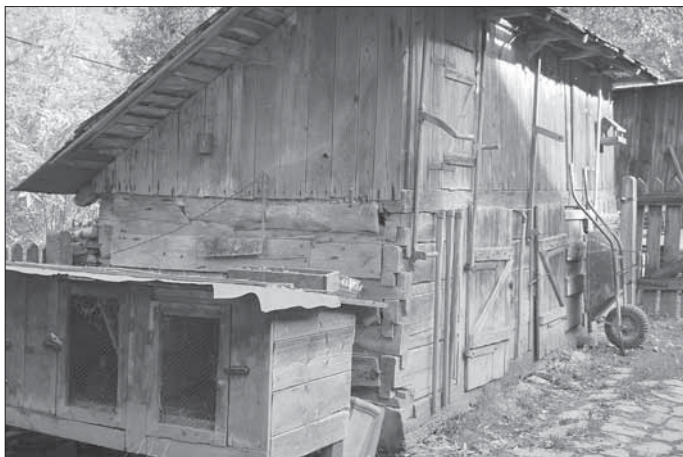
Krmníky pro vepře, nad nimi kurníky pro slepice a samostatně stojí králikárna ve dvoře usedlosti čp. 68. Vápenice 2007.