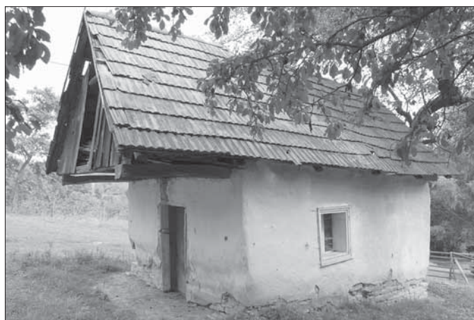
Původní sušárna na ovoce u usedlosti čp. 62. Od konce 19. století přestavovaná k bydlení. Poslední obyvatelé zde žili do 50. let 20. století, pak upraveno jako skladovací prostor. Žitková – Koprvasy 2007.