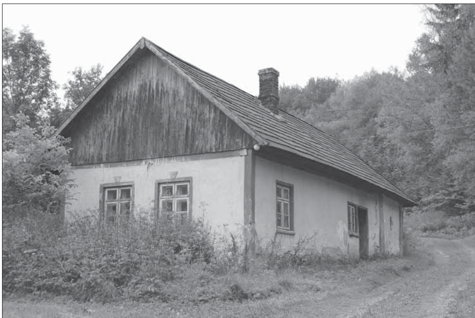
Usedlost čp. 29 – trojprostorové stavení z nepálených cihel. Žitková–Koprvasy 2007.