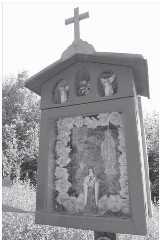
Zajímavě pojatá kaplička Panny Marie Lurdské je postavená v místě, kde se zjevovali vodníci a světloňoši. Žitková 2007.