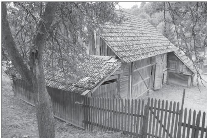
Příčně průjezdná stodola ve dvoře usedlosti čp. 79 – sloupková konstrukce s trémovou výplní do drážek. Žitková 2007.