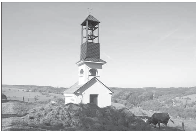
Novodobá zvonice z roku 1992 ve Vápenicích.