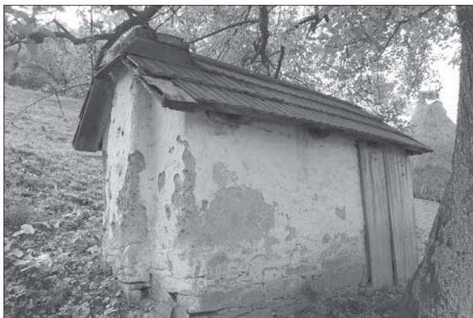
Samostatně stojící pec na chleba u usedlosti čp. 68 – z nepálených cihel prostor k pečení, ze dřeva je bedněný přípravný prostor. Vápenice 2007.