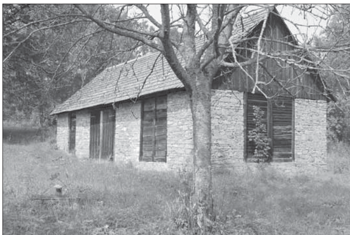
Kamenná, příčně průjezdná stodola u mlýna Petřivaldských čp. 32. Žitková 2007.