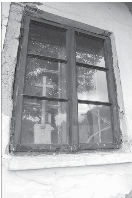
Ochranný křížek za oknem usedlosti čp. 197. Žitková – Pí-tínské paseky 2007.

Velké změny se projevují v otopném systému . Jeho vývoj na Kopanicích je odlišný od ostatních oblastí Slovácka. Tradiční topeniště je prezentováno pecí v jizbě. Ty jsou ve 20. století bourány a nahrazovány sporáky v původním pitvoru, který se tak přeměňuje v kuchyni, do které se z jizby přeneslo vaření. V původní jizbě, z níž se stala místnost ke spaní, se topilo železnými kamny. Na Kopanicích je tak přeskočena jedna fáze vývoje otopného systému, tedy nedochází k přesunu otvoru pecí do síně a vzniku černých kuchyní, jako se to dělo jinde na Slovácku. Pece se zde proto začínají budovat v podobě samostatných staveb v blízkosti obytného domu. Se zánikem starých pecí zanikají i dymníky, které jsou nahrazeny zděnými komíny.