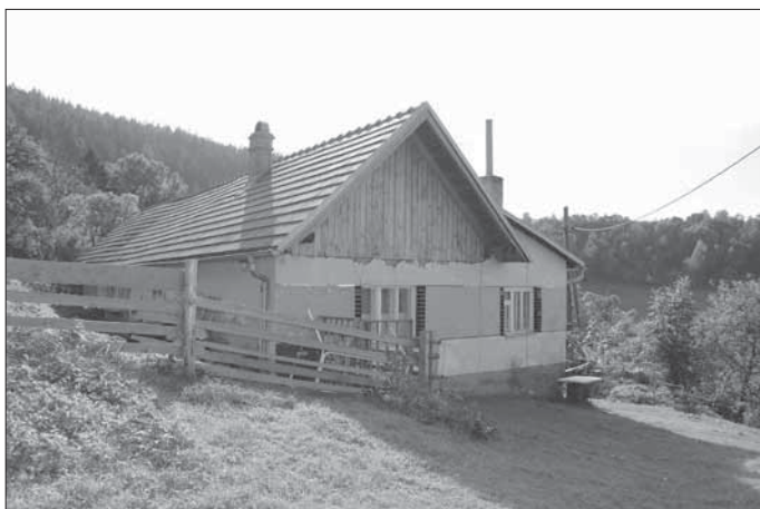
Usedlost čp. 17 pocházející přibližně z 50. let 20. století. Vápenice 2007.