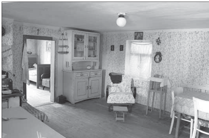
Ustedlost čp. 150 – dvouprostorová dispozice – kuchyně, ložnice. Starý Hrozenkov – Čjerné 2007.