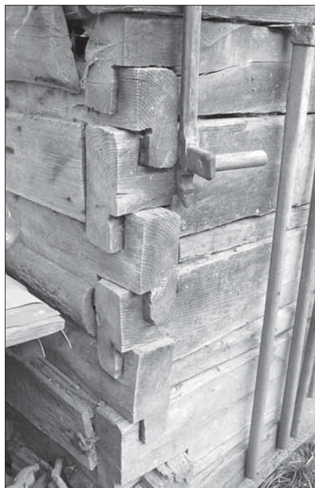
Detail trámové vazby na zámek u krmníků na čp. 68. Zhotovil majitel usedlosti. Vápenice 2007.