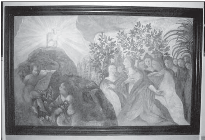
6. Malba na západní stěně kaple sv. Viktorie po restaurování.