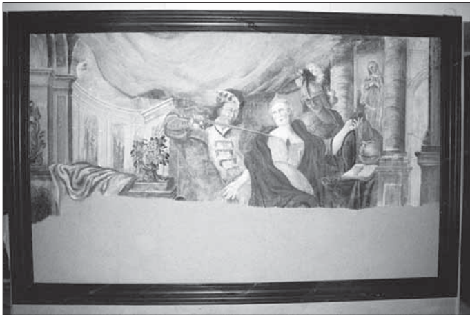
5. Malba na východní stěně kaple sv. Viktorie.