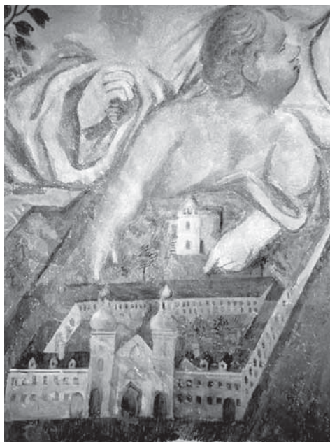
3. Detail veduty kláštera.