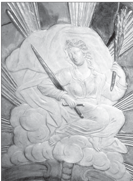
9. Reliéf sv. Viktorie před odstraněním nepůvodní výmalby klenby.