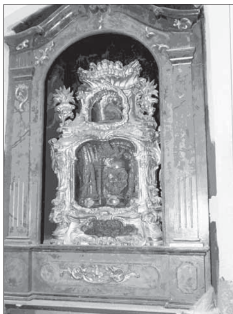
10. Relikviář sv. Viktorie v dřevěném retabulu před restaurováním.