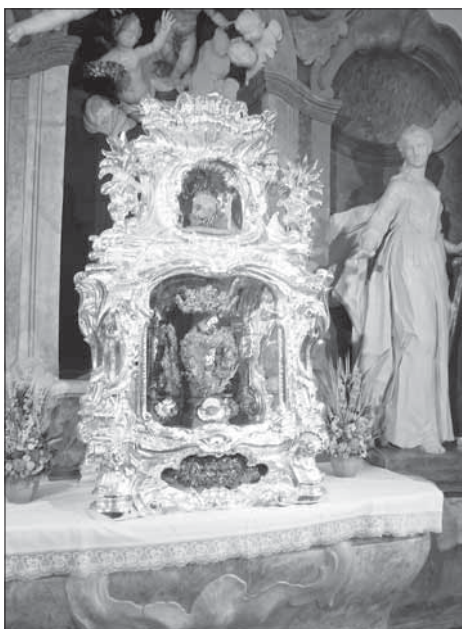
11. Relikviář sv. Viktorie – současný stav.