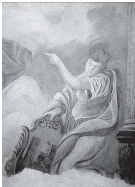
4. Detail štítonoše s erbem města Uherské Hradiště.