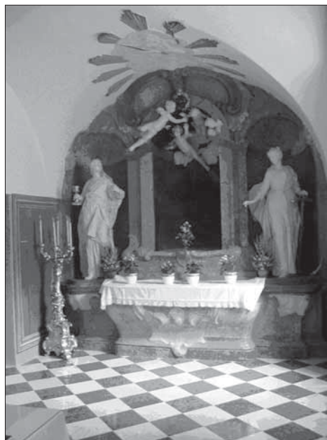
8. Jižní strana kaple sv. Viktorie.