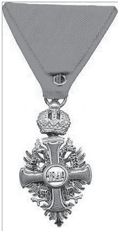
1., 2. Rytířský kříž Řádu Františka Josefa (avers a revers).