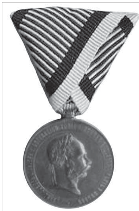
6. Válečná medaile (avers).