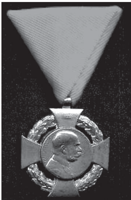
7. Jubilejní kříž pro občanské státní zaměstnance z roku 1908 (avers).