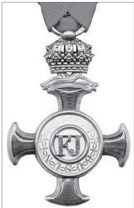
4. Zlatý záslužný kříž s korunou (avers).