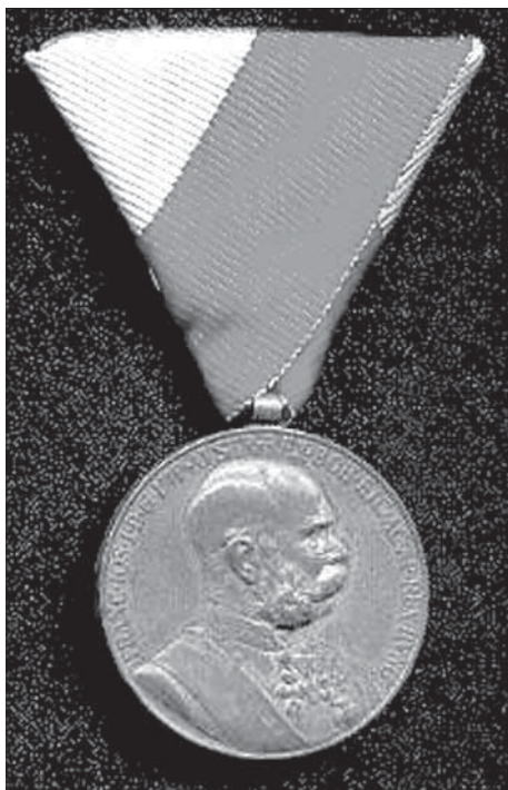
5. Jubilejní pamětní medaile pro občanské státní zaměstnance z roku 1898 (avers).