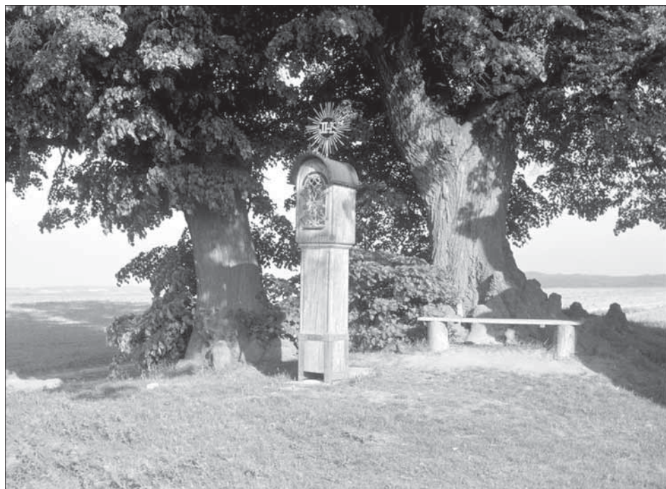
Boží muka – detail z počátku 19. století.