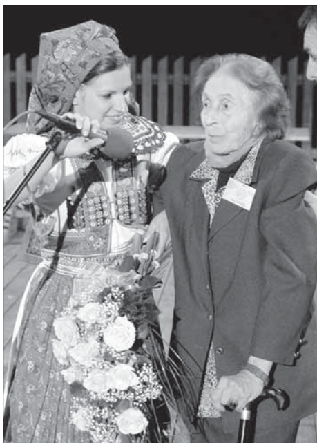
Na Hornáckých slavnostech 2005.

Odrasovým můstkem pro její folklorní a sběratelskou činnost se stalo rodné Hornácko, kde se seznamovala se zdejšími zvykoslovím, krojovou pestrostí a dalšími projevy lidové kultury. Tady vznikaly její první sběry a zápisy dětského folkloru, intenzívně vnímala sílu místních tanců. Od