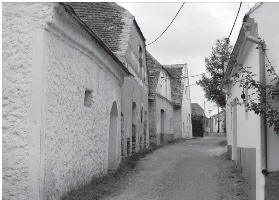
Areal vinohradnických sklepů v Hnanicích.