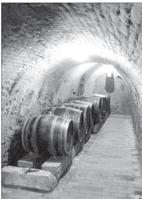
Interiér podzemní části sklepa v Hnanicích.