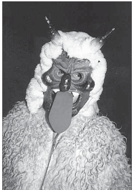
Mikulášská obchůzka 5. 12. 2005: čerti a Svatý.