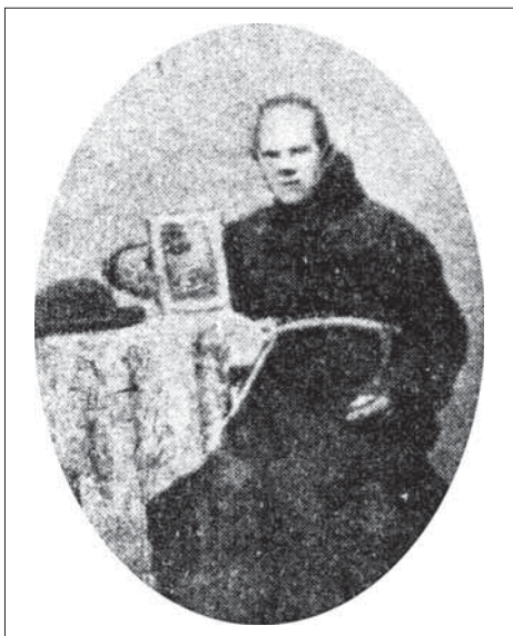
3. Populární františkán Erazim Vitásek.