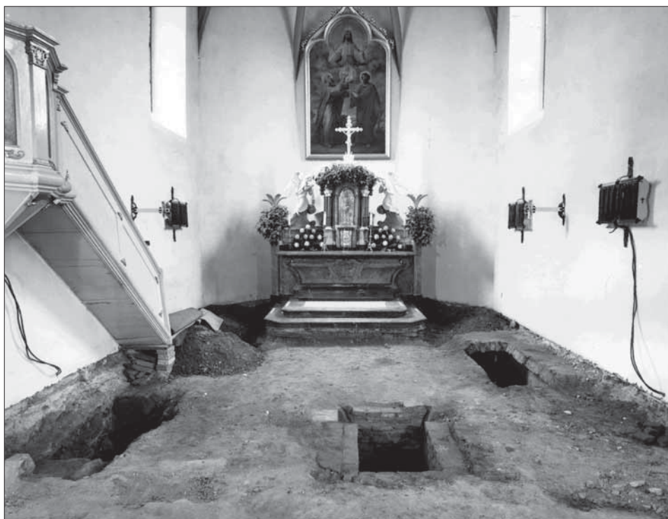
1. Pohled na plochu výzkumu v kněžišti kostela se dvěma kryptami a sondou u základů kostela.

o mocnosti 20 cm a byla vykopána až do hloubky 250 cm od normální úrovně podlahy kostela, skutečná hloubka sondy byla 205 cm (zbylých 45 cm tvořila stavební navázka pod bývalou podlahou kostela). Na protější straně v profilu výkopu se vyrýsovala část valené klenby pravděpodobně další krypty, která ovšem nebyla zkoumána. Základ kostela byl tvořen masivními, převážně pískovcovými lomovými kameny kladenými na hrubou vaznou šterkovou maltu tmavě šedého až hnědého zbarvení. Základy byly kompaktní a sahaly do proměnlivé hloubky 125–145 cm od vrchu výkopu a měly charakter gotického zdiva. Zbytek profilu výkopu byl tvořen kompaktním šterkovým podložím, zjištěným již při výzkumu J. Kohoutka v roce 1994.